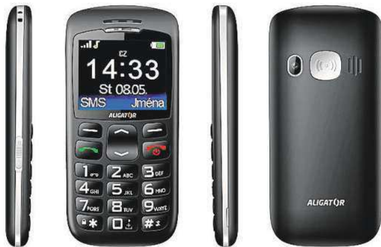
Velmi lehký a ergonomicky tvarovaný telefon

bil ovládat skutečně každý. Komfort uživatele zvyšuje i přiložený stojánek, který telefon zároveň nabíjí. Výdrž baterie na jedno nabití může být až impozantních 15 dní.