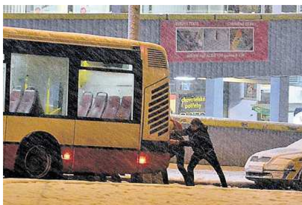
V Makovského ulici v Řepích se v pondělí tlačilo.