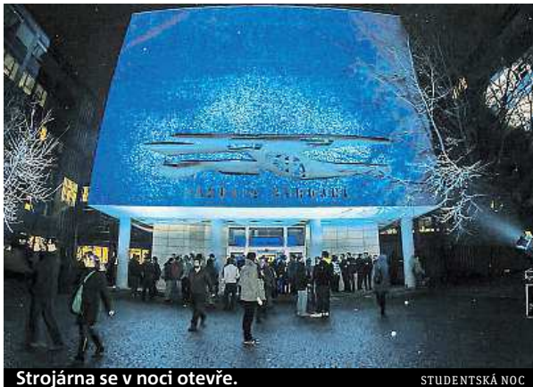
Strojárna se v noci otevře.

Do organizace samotné akce se zapojil i student této