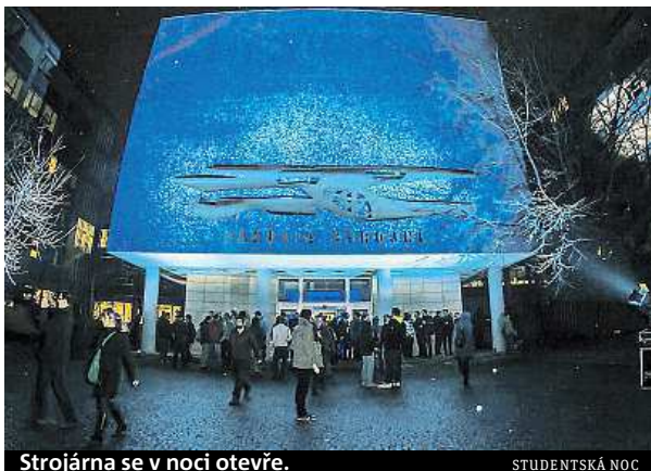
Strojárna se v noci otevře.

Do organizace samotné akce se zapojil i student této