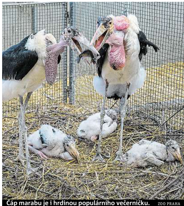
Čáp marabu je i hrdinou populárního večerníčku.

V zoo se po osmi letech vylíhla tři mláďata čápa marabu. Na svět se vyklubala na konci ledna a teď se už mají čile k světu. „Je to velký úspěch, který nás těší o to víc, že jsme se jich dočkali od samice, která byla jinými zoologickými zahradami zavržena jako nevhodná do chovu a doposud nikdy nesnesla žádné vejce,“ vysvětluje kurátor ptáků Zoo