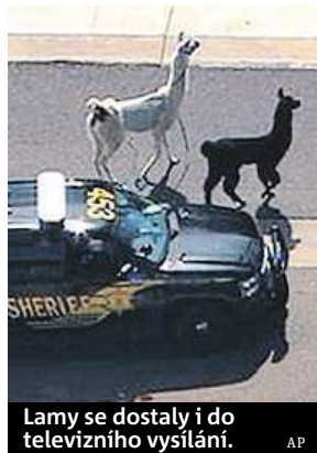
Lamy se dostaly i do televizního vysílání.

Velká bílá lama a její menší černá kamarádka utekly ve čtvrtce z domova pro důchodce, kde byly součástí speciální terapie. Místní televizní stanice ABC 15 nezaváhala a okamžitě vyslala do vzduchu helikoptéru, která celý úprk přenášela živě. Tisíce Američanů na Twitteru nadšeně komentovaly každý čin