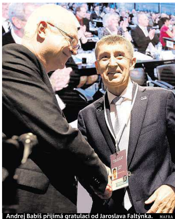
Andrej Babiš přijímá gratulaci od Jaroslava Faltýnka.

Delegáti sněmu ANO včera bez diskuse schválili úpravy stanov uskupení. Jsou vesměs formální, větší obecnosti se dočkaly programové cíle. Stanovy dál potvrzují silné postavení předsedy hnutí, jímž je miliardář, majitel agropotravní národního holdingu Agrofert a zakladatel nyní vládního uskupení Andrej Babiš. Ten v sobotu podle očekávání potvrdil funkci předsedy hnutí. Od delegátů získal sto procent hlasů. Babiš kritizoval ČSSD, s níž je ANO ve vládní koalici ještě spolu s KDU-ČSL. Sociální demokraté na jeho slova reagovali tím, že podobné výpady koalici spolupráci neprospívají. Předseda lidovců Pavel Bělobrádek chápe Babišovy výroky tak, že mu ve vládě překážejí koalici partneri a raději by vládl sám. Premiér a předseda ČSSD řekl, že lidé od vládních stran nečekají vzájemné napadání, Babišovi nicméně pogratuloval ke zvolení. Prvním místopředsedou se stal Jaroslav Faltýnek. ČTK