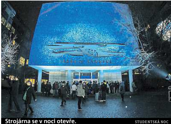
Strojárna se v noci otevře.

Do organizace samotné akce se zapojil i student této