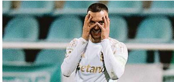
Spartané nastoupili na Julisce v bílozlatých dresech.

Sparta prohrála jediný z dosavadních 22 vzájemných ligových zápasů a Dukla ji doma na Julisce v nejvyšší soutěži porazila jen jednou z 11 utkání. Sparta zvítězila teprve ve třetím z posledních sedmi kol, Dukla vyhrála jedi-