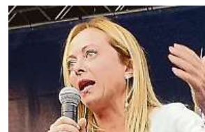
Giorgia Meloniová v bazilice a ve skutečnosti PROFIMEDIA a IN