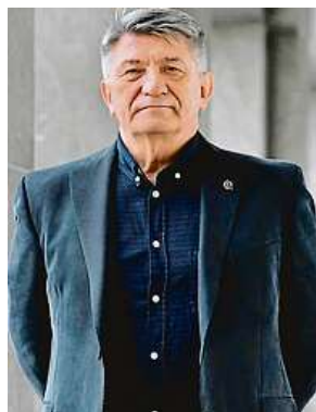
Ruský režisér Alexandr Sokurov se postavil Putinovi.