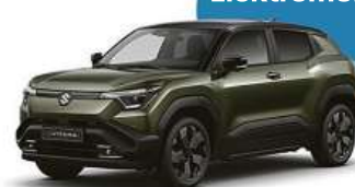
Suzuki e VITARA