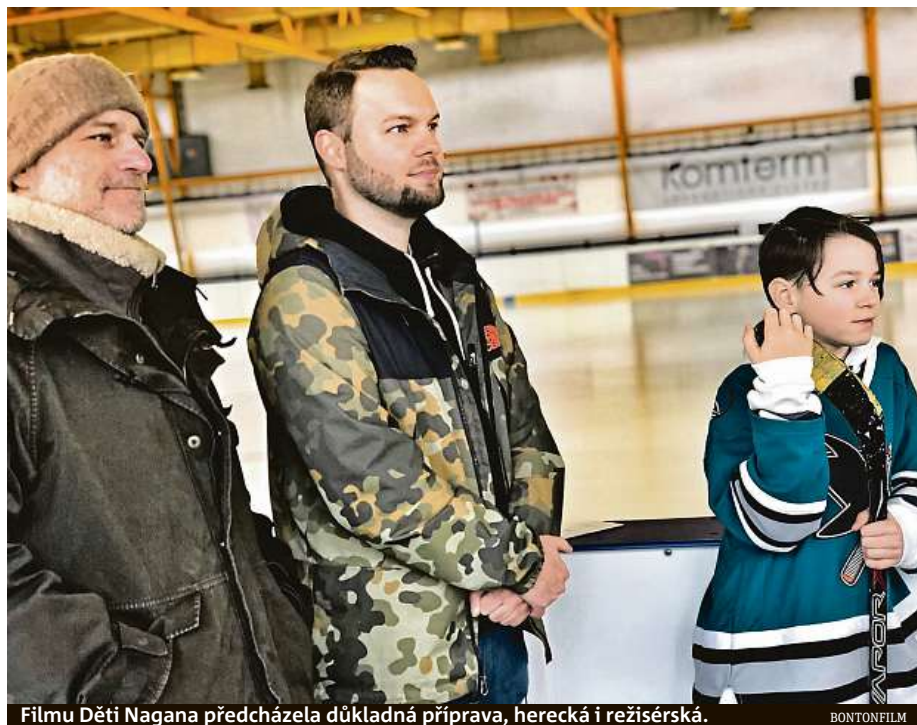
Filmu Děti Nagana předcházela důkladná příprava, herecká i režisérská.

Hašek vyzdvihl, že film není ani tolik o samotném turnaji, ale o tom, jakou znamenal inspiraci pro děti. Líbí se mu také, že jde o rodinný film o mladých lidech. „Nevím, jestli bude moje rolička v sekundách, nebo minutách, ale ta chvilka má určitý