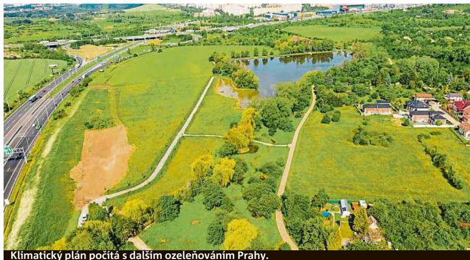
Klimatický plán počítá s dalším ozeleňováním Prahy.

Prostor pro hospodaření se srážkovou vodou v budovách i ve veřejném prostoru, pro rozvoj zeleně a využití chytrých technologií i pro možnosti každého z nás snižovat svoji energetickou spotřebu, včetně možností, které nabízí změna jídelničky, cestovních, pracovních a životních návyků je, dá se říci, nekonečný. Adaptovat neznamená omezit ruch města, ba skoro přesně naopak – žít s tímto městem v těsnějším, ale rozumněji nastaveném systému. FILIP JAROŠEVSKÝ