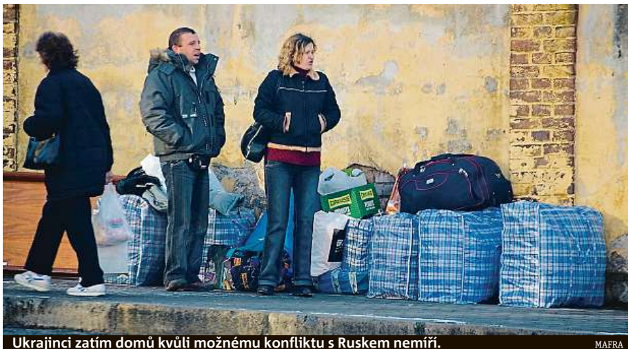
Ukrajinci zatím domů kvůli možnému konfliktu s Ruskem nemíří.

Personální agentury, které dovážejí do země pracovníky z východu, sice ještě odliv Ukrajinců nijak silně neznamenávají, pro jistotu už ale rozvažují sítě ve Vietnamu, v Srbsku a dalších oblastech, odkud by cizinci vyvrazili případný válečný odliv Ukrajinců. I přesto je naříkání nad personální bídou,