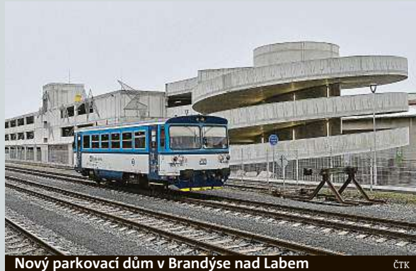
Nový parkovací dům v Brandýse nad Labem

Brandýs nad Labem u vlakového nádraží otevřel nový parkovací dům pro 316 aut a 76 kol. Ve městě s téměř 19 tisíci obyvateli má usnadnit situaci především řidičům, kteří dále cestují vlakem nebo autobusem. Většinu investice za více než 140 milionů korun uhradila evropská dotace. Jde o další ze zachytných parkovišť P+R, která vznikají ve Středočeském kraji. Obyvatelům města a okolních obcí usnadní nová parkovací místa cestování do Prahy, dosud využívali pro zaparkování prostory v centru města nebo přilehlých oblastech.