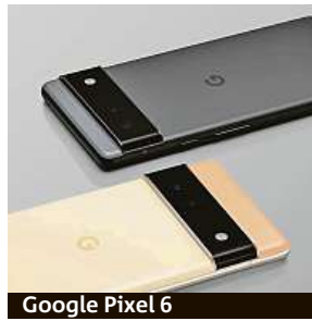
Google Pixel 6

podporuje natáčení videí až do 4K rozlišení při 60 fps, maximální snímkovací frekvence 240 fps dosáhne při klasickém Full HD rozlišení. Selfie