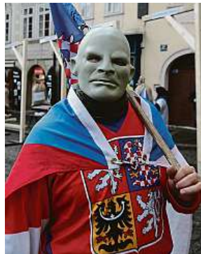
Vyostřených situací bylo hodně. U šibenic protestoval také Fantomas.