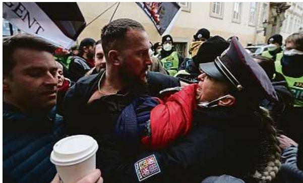
Vyostřených situací bylo hodně. U šibenic protestoval také Fantomas.