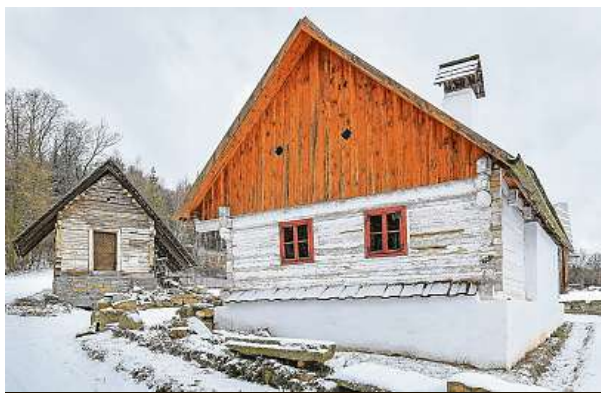
Jedna ze stávajících dominant skanzenu