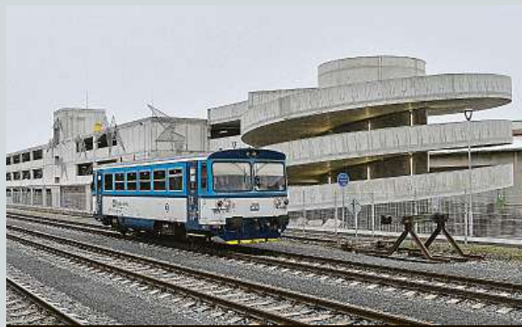
Nový parkovací dům v Brandýse nad Labem

Brandýs nad Labem u vlakového nádraží otevřel nový parkovací dům pro 316 aut a 76 kol. Ve městě s téměř 19 tisíci obyvateli má usnadnit situaci především řidičům, kteří dále cestují vlakem nebo autobusem. Většinu investice za více než 140 milionů korun uhradila evropská dotace. Jde o další ze zachytných parkovišť P+R, která vznikají ve Středočeském kraji. Obyvatelům města a okolních obcí usnadní nová parkovací místa cestování do Prahy, dosud využívali pro zaparkování prostory v centru města nebo přilehlých oblastech.