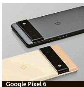
Google Pixel 6

podporuje natáčení videí až do 4K rozlišení při 60 fps, maximální snímkovací frekvence 240 fps dosáhne při klasickém Full HD rozlišení. Selfie