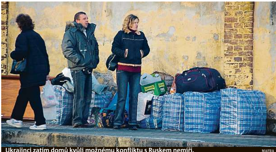
Ukrajinci zatím domů kvůli možnému konfliktu s Ruskem nemíří. MAIRA

Personální agentury, které dovážejí do země pracovníky z východu, sice ještě odliv Ukrajinců nijak silně neznamenávají, pro jistotu už ale rozvažují sítě ve Vietnamu, v Srbsku a dalších oblastech, odkud by cizinci vyrovnali případný válečný odliv Ukrajinců. I přesto je naříkání nad personální bídou,