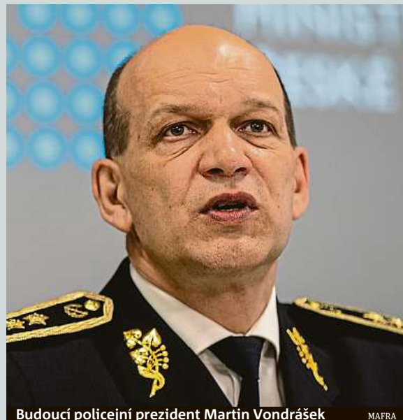
Budoucí policejní prezident Martin Vondrášek