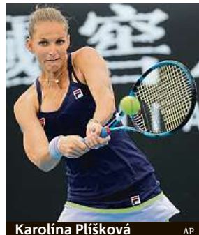
Karolína Plíšková

Karolína Plíšková porazila Italku Elisabettu Cocciarettoovou 6:3, 6:2. Plíšková měla v prvním kole volný los a proti Cocciarettové si pomohla třiceti vítěznými údery, z toho sedmi esy. Nečelila ani jednomu brejkbolu a Italka vzala v každém setu podání