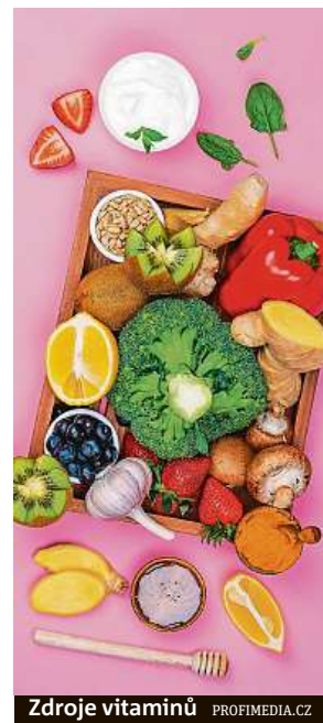
Zdroje vitamínů

Mezi další významné přírodní pomocníky patří rakytník. Má biostimulační účinky a doporučuje se při rekonvalescenci, podporuje tvorbu žluči a trávicích enzymů, stimuluje činnost jater a plic, reguluje krevní oběh. Pro zlepšení nejen fyzické, ale i psychické odolnosti je pak vhodná rozchodnice růžová, ženšen, vilcacora (kočičí dráp) či aloe. KAMILA HUDEČKOVÁ