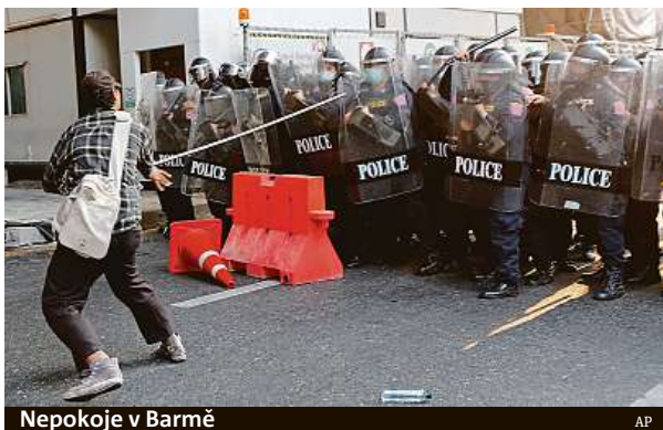
Nepokoje v Barmě

Vojenský převrat, o kterém se už několik týdnů spekovalo – ale armáda ho popírala – se stal skutečností. Vojáci zaujali pozice v ulicích ekonomického centra Rangúnu a obsadili také městskou radnici. Telefonní spojení s hlavním městem Neipjijto i s Rangúnem bylo přerušeno, přestala vysílat státní televize, vypadl internet.