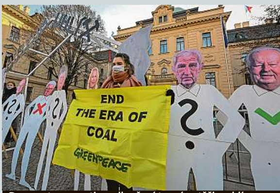
Demonstrace proti prodloužení termínu těžby uhlí