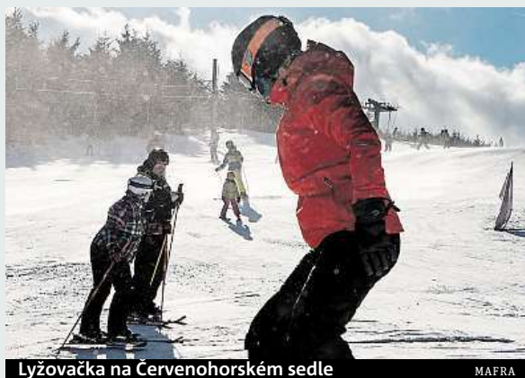
Lyžařka na Červenohorském sedle