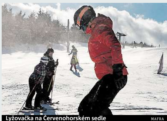
Lyžačka na Červenohorském sedle