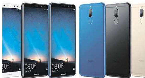
Mobilní telefon Huawei Mate 10 lite

Ani po stránce výkonu na tom není Mate 10 lite vůbec špatně. Je vybaven osmijádrovým procesorem s frekvencí 2,36 GHz, 4 GB RAM a 64GB úložným prostorem. Celý tele-