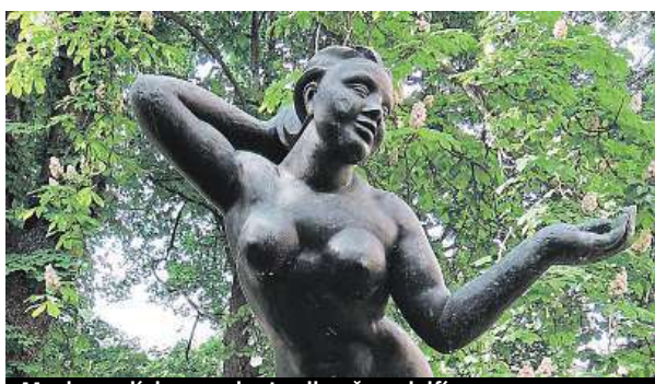
Muchovy dívky a socha Jezdkyně na delfínu