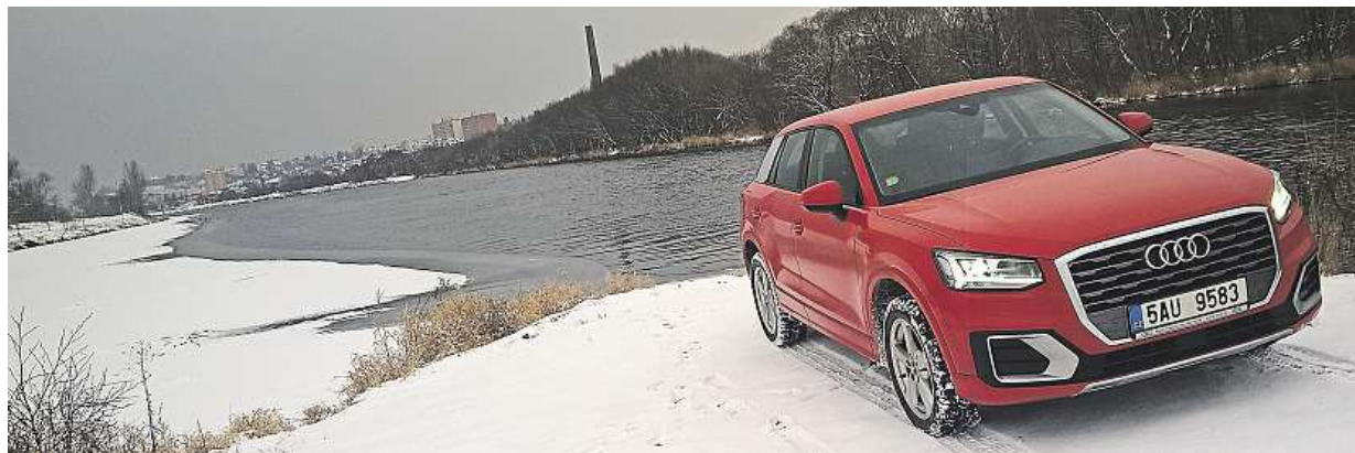
Pohon všech kol je za příplatek. Ale i bez něj se nemusíte s autem bát průzkumu neznámých míst v lehkém terénu. 2X METRO