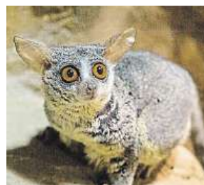
Komba ušatá ZOO OSTRAVA