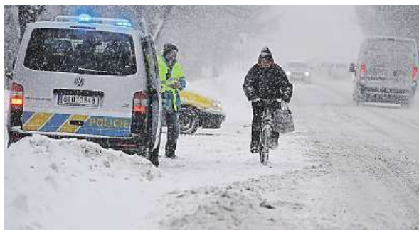
Sever Moravy zasáhla sněhová kalamita.

Velké komplikace způsobil sníh, který Česko zaspával další den. Včera se na silnicích stala řada nehod, zpoždily se vlaky i městská hromadná doprava. Policie musela uzavřít několik úseků pro kamiony. Například mezi Ostravicí a Bílou na severu Moravy. Problémy přineslo rozhodnutí Rakušanů, že do své země nepustí kamiony bez řetězů. To způsobilo ráno několikakilometrovou kolonu kamionů u hranice právě s Rakouskem. Také v Čechách byly potíže na hranicích, dálnice D8 v Ústeckém kraji byla před hranicí s Německem několikrát krátce uzavřena kvůli uvízlým autům. Počasí však těší lyžaře. Podle meteorologů bude sněžit i nadále.