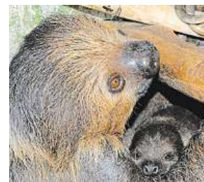
Lenochod ZOO ÚSTÍ NAD LABEM