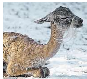
Lama guanako ZOO PRAHA