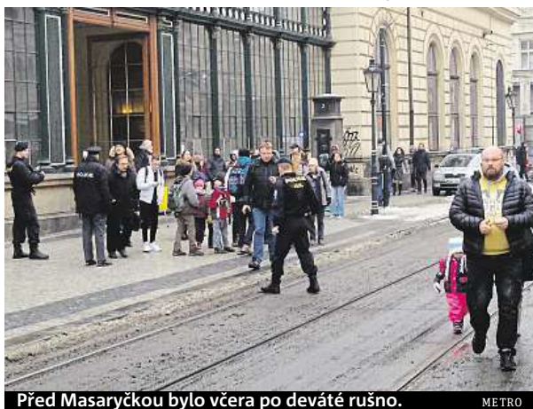
Před Masaryčkou bylo včera po deváté rušno.

Poté, co tašku prozkoumal přivolaný pyrotechnik, se doprava po necelé hodině opět rozjela. Podle policejního mluvčího Jana Daňky však nebylo podezřelé zavazadlo, které se ukázalo jako neškodné, pod zemí, ale venku u budovy. „Nešlo o nástražný výbušný systém ani o cokoli jině-