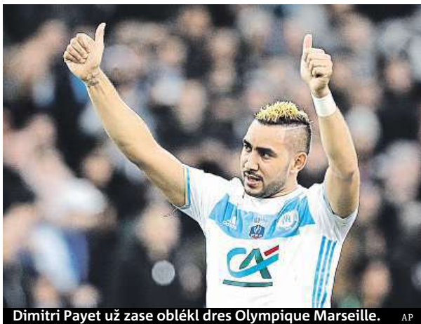
Dimitri Payet už zase oblékl dres Olympique Marseille.

Francouzský fotbalista přitom teprve loni podepsal s desátým týmem Premier League smlouvu na pět a půl roku. Po transferu, který byl