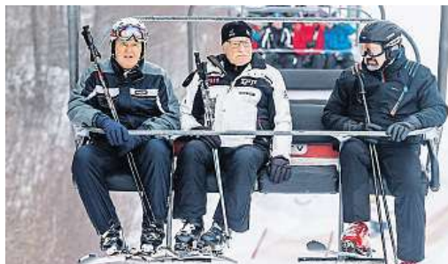
Sníh si jel na Moninec užít Václav Klaus.