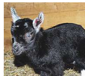
Koba kamerunská ZOO D. K.