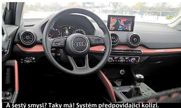
A šestý smysl? Taky má! Systém předpovídající kolizi.