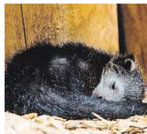
Binturong ZOO OSTRAVA