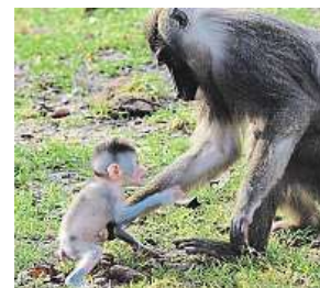
Dril černolící ZOO DVŮR KRÁLOVÉ