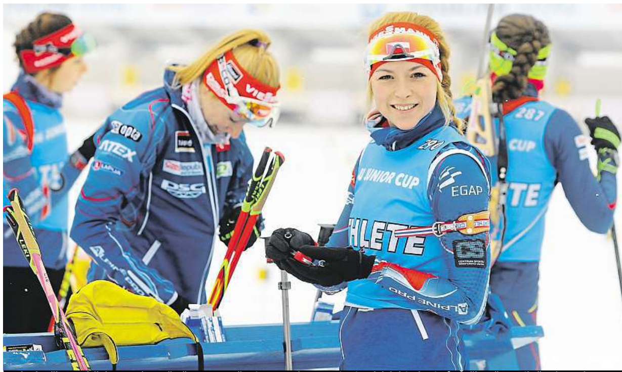
Ode dneška probíhá v Novém Městě na Moravě mistrovství Evropy juniorských biatlonistů. Češky včera pilně trénovaly.

Existenční minimum. Lidem, kteří nebudou šest měsíců pracovat, se sníží příspěvek na živobytí na 2200 Kč. Zpět na 3410 korun. Podle novely zákona si to musí odpracovat. Šance. Veřejně prospěšné práce STRANA 6