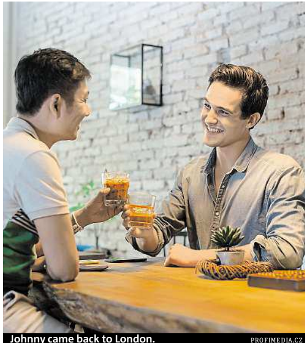
Johnny came back to London.

Johnny: Yeah... you should go... Olivia: So you're back for good? Johnny: For a year, at least... then we'll see! Harry: Oh, by the way – this is Bindyu – she's my girlfriend... Johnny: Nice to meet you! Well done, Harry... Bindyu: Nice to meet you too. Fadi: We'll have to start the football team again! All: Hi Carlos! Carlos: Oh, Hi! Hi Sarah! Sarah: Hello! Harry: Johnny – this is our new Brazilian friend, Carlos... Johnny: Hi Carlos! You're Brazilian? You must be good at football... join our team! Carlos: Erm, well, actually, I'm afraid I'm no good at football... Johnny: Well, you'll fit in with our team then! Carlos: Eh? Harry: Never mind, Carlos, it's not important... Johnny: So what's been going on here while I've been away? All: Er, well... hmmm... Harry: Lots of stuff. Johnny: Go on! I saw that banner in the window – what's up? Why do you need to save the café? Olivia: And my shop... Harry: Well, did you see that building site just behind the café? Johnny: Yes, I did actually – it looks like they're building something big, looks interesting... Olivia: Hmmm... Harry: Yeah, luxury flats... Olivia: The problem being... Tony: ...they want to