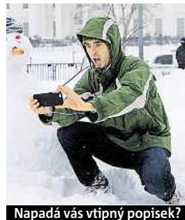
Napadá vás vtipný popisěk?

Napište bublinu a reagujte na sloupek na: www.facebook.com/denikmetro