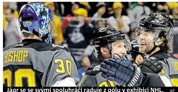
Jágr se se svými spoluhráči raduje z gólu v exhibici NHL.

stranách 23 gólů. „Samotné zápasy byly celkem dobré. Byl jsem překvapený. Hrál se defenzivně a každý chtěl vyhrát,“ doplnil Jágr. ČTK