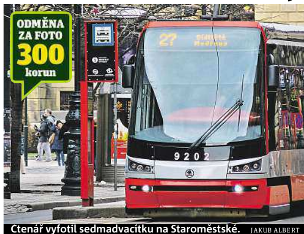
Ctenář vyfotil sedmadvacítku na Staroměstské.

Nová linka 27 jezdí po zkrácené trase 17: Levského – Nádraží Braník – Výtoň – Palackého náměstí – Jiráskovo náměstí – Staroměstská – Malostranská – Právnická fakulta – Staroměstská a zpět do Modřan. ROW