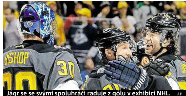
Jágr se se svými spoluhráči raduje z gólu v exhibici NHL.

stranách 23 gólů. „Samotné zápasy byly celkem dobré. Byl jsem překvapený. Hrál se defenzivně a každý chtěl vyhrát,“ doplnil Jágr. ČTK