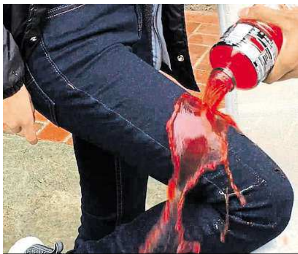
Přijde revoluce v oblékání?

Firma zdůrazňuje, že to jsou první džíny, které nemusíte práť, protože se na nich nedrží skvrny. To však není ta pravá inovace, se kterou