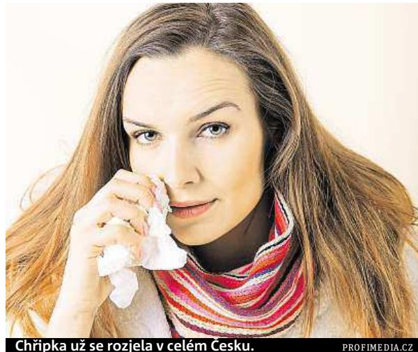
Chřipka už se rozjela v celém Česku.

Onemocnění působí několik chřipkových virů, nejčastěji