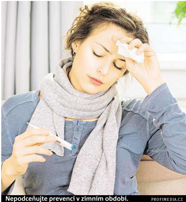
Nepodceňujte prevenci v zimním období.

Jestli vás bolí klouby i svaly, teplota se vyšplhala nad devětatřicet a máte pocit, že vás přejelo nákladní auto, pak jste pravděpodobně dostali chřipku. Víte, jak si s ní poradit?