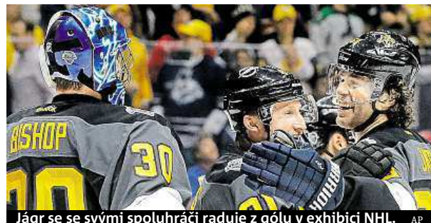
Jágr se se svými spoluhráči raduje z gólu v exhibici NHL.

stranách 23 gólů. „Samotné zápasy byly celkem dobré. Byl jsem překvapený. Hrál se defenzivně a každý chtěl vyhrát,“ doplnil Jágr. ČTK