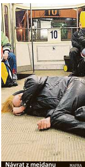
Návrat z mejdanu MAERA

Zdálo se vám, že restaurace nejsou tak plné jako v jiných letech? Zdání klame. Tradiční setkání se konala i v soukromí firem.