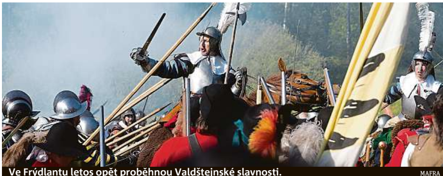
Ve Frydlantu letos opět proběhnou Valdštejnské slavnosti. MAFRA

Rozsáhlá rekonstrukce hradu Karlštejn na Berounsku je u konce, nové návštěvnické centrum by mělo být v provozu nejpozději od dubna. Opravy stály přes 150 milionů korun a začaly před dvěma lety. ČTK