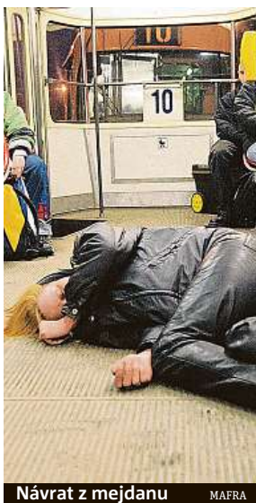
Návrat z mejdanu MAERA

Otevřela dveře do ztemnělého odpočinkového prostoru. Tam, kde během dne lidé buď odpočívají, zacvičí si na karamatce, nebo tu chvíli hlídají rodičům děti, pro které nemají doma dozor, ovane v ranní tmě příchodzího nepominutelný pach alkoholových výparů. „Tady bych asi ani neměla škrtat zápalkou,“ říká s humorem uklízečka.