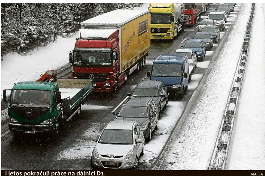
I letos pokračují práce na dálnici D1.

V novém roce poroste i minimální mzda, zvýší se o 1250 korun, na 14 600 korun. S minimální mzdou, za