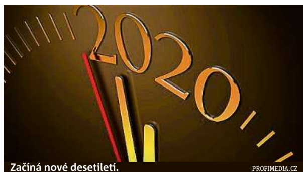
Začíná nové desetiletí.