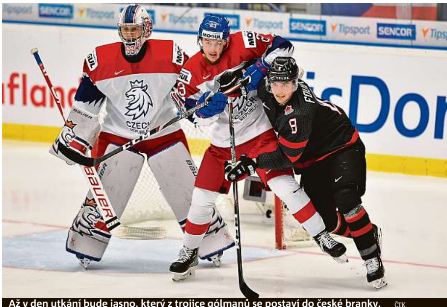
Až v den utkání bude jasno, který z trojice gólmanů se postaví do české branky. ČTK

Švédsko v základních částech juniorských MS vyhrálo už 52 utkání v řadě, naposledy prohrálo v prosinci 2006 s Kanadou. Češi se však dnes od 20 hodin chtějí hlavně soustředit na svůj výkon. ČTK