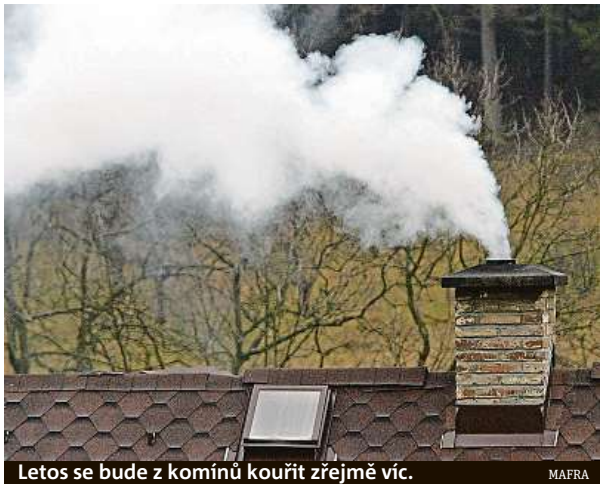
Letos se bude z komínů kouřit zřejmě víc.