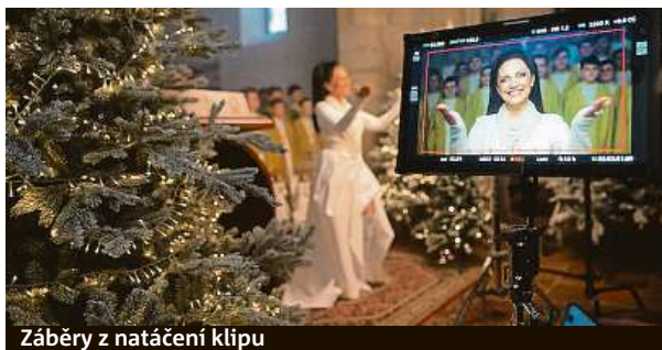
Záběry z natáčení klipu