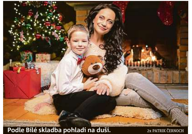
Podle Bílé skladba pohladí na duši.