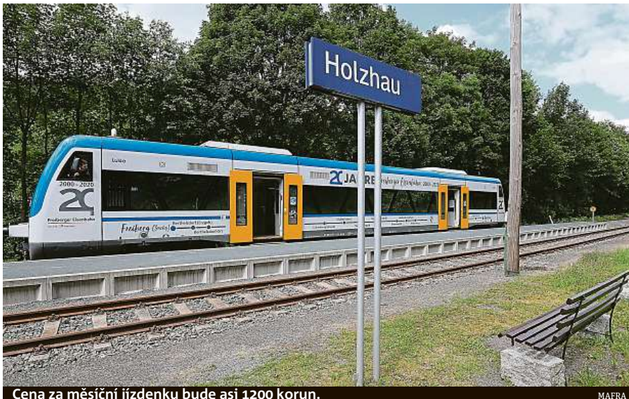
Cena za měsíční jízdenku bude asi 1200 korun.

Jízdenka bude stát 49 eur na měsíc (1200 korun), spolková vláda a spolkové země ale dosud nevyřešily podro-