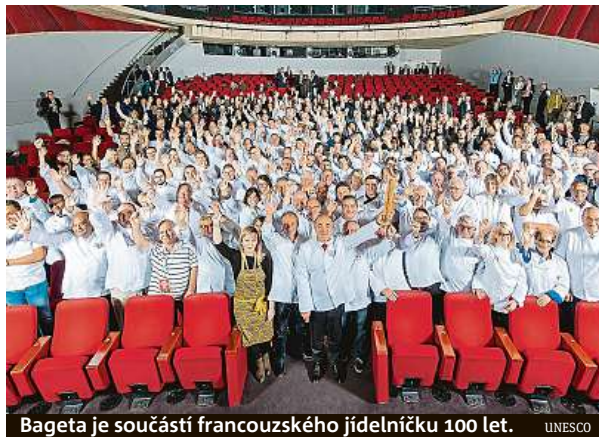
Bageta je součástí francouzského jídelníčku 100 let. UNESCO

Spotřeba baget ve Francii postupně klesá, přesto se jich denně upeče přibližně dvanáct milionů. Klesá také po-