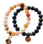
Náramek Bára Poláková 400 Kč