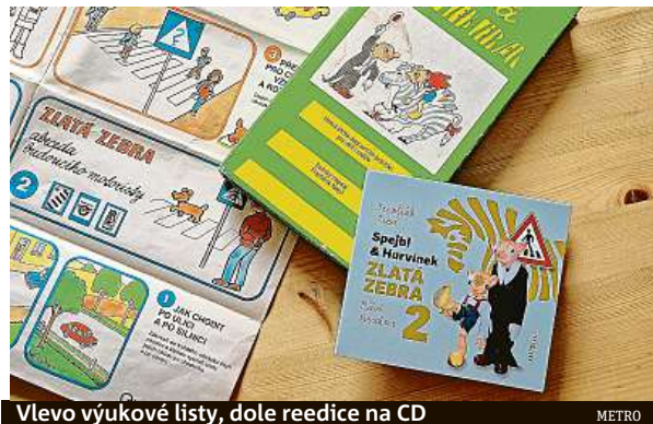
Vlevo výukové listy, dole reedice na CD

„Máš štěstí, ty i tvoji kamarádi, že vašim rozhlasovým