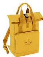
Batož Sestry Geislerovy 850 Kč