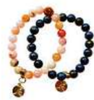
Náramek Bára Poláková 400 Kč