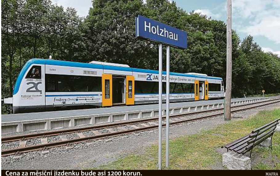
Cena za měsíční jízdenku bude asi 1200 korun.

Jízdenka bude stát 49 eur na měsíc (1200 korun), spolková vláda a spolkové země ale dosud nevyřešily podro-