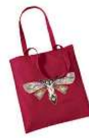
Taška Léna Brauner 300 Kč