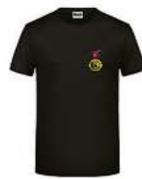
Pánské tričko Dan Bárta 450 Kč