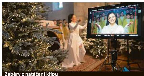
Záběry z natáčení klipu