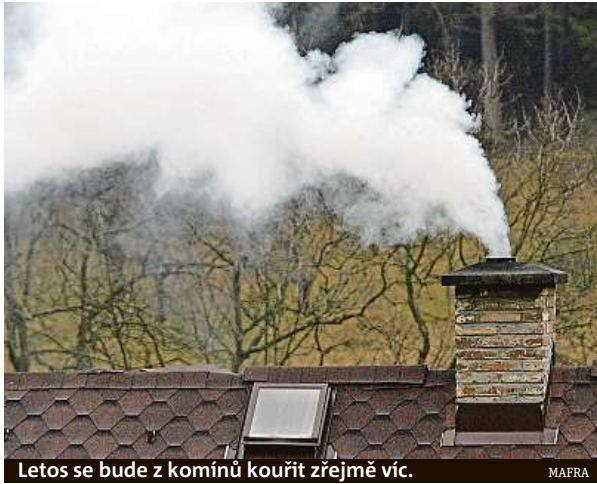
Letos se bude z komínů kouřit zřejmě víc.