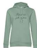
Dámská mikina Design hero 990 Kč

Kompletní nabídku produktů naleznete na www.klokart.cz f klokart i klokart