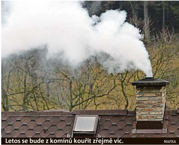
Letos se bude z komínů kouřit zřejmě víc.