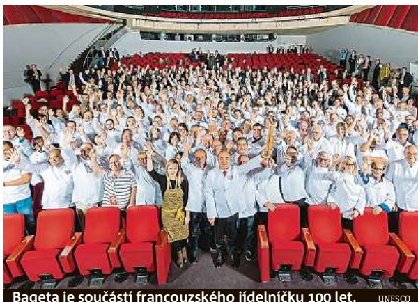
Bageta je součástí francouzského jídelníčku 100 let. UNESCO

Spotřeba baget ve Francii postupně klesá, přesto se jich denně upeče přibližně dvanáct milionů. Klesá také po-