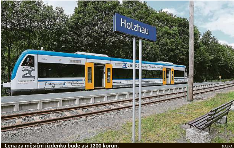
Cena za měsíční jízdenku bude asi 1200 korun.

Jízdenka bude stát 49 eur na měsíc (1200 korun), spolková vláda a spolkové země ale dosud nevyřešily podro-