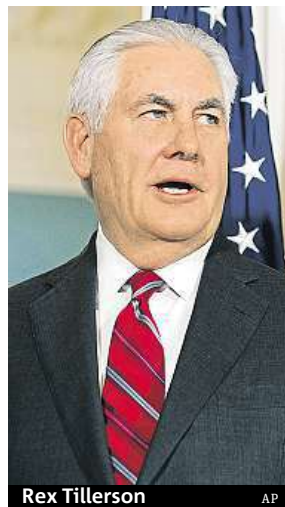
Rex Tillerson

Vysocí vládní úředníci údajně deníku sdělili, že Pompeo by měl v čele největší americké rozvědky nahradit senátor Tom Cotton, republikán ze státu Arkansas, který je klíčovým Trumpovým spojencem a odborníkem v otázkách národní bezpečnosti. S novým postem by souhlasil.