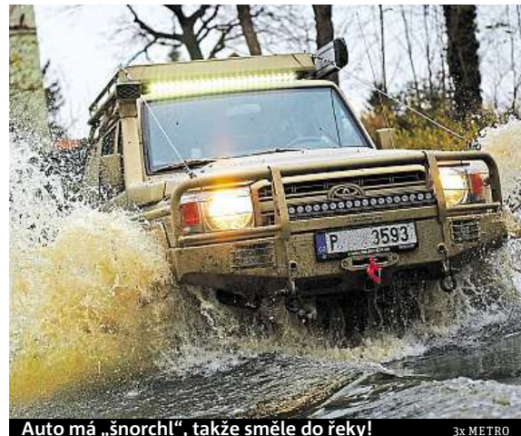
Auto má „šnorchl“, takže směle do řeky!