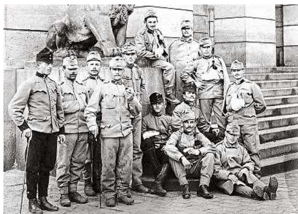
Vojenští rekonvalescenti před Rudolfinem na podzim 1914