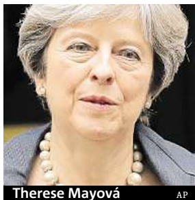
Therese Mayová AP

Šéf Bílého domu zveřejnil tři videa s rasistickým podtextem.