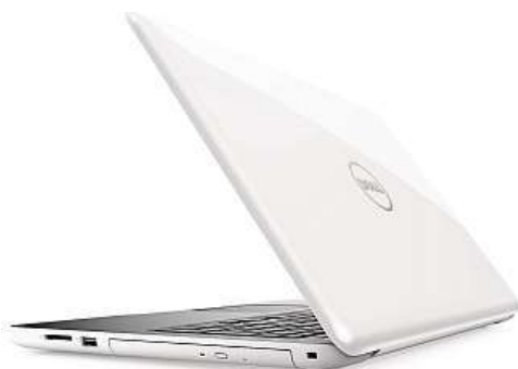
DELL Inspiron 15 (5567)

Pod elegantní rouškou bílého šasi vyčkává na probuzení výkonný procesor sedmé generace Intel Core i5-7200U. Společnost mu dělá 8 GB operační paměti typu DDR4, samostatná grafická karta AMD Radeon R7 M445 a také extrémně rychlé SSD s kapacitou 256 GB. Koktejl namícha-