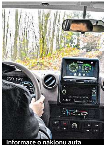
Informace o náklonu auta