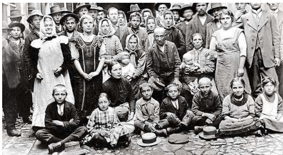
Haličtí uprchlíci v Klimentěské ulici na podzim 1914