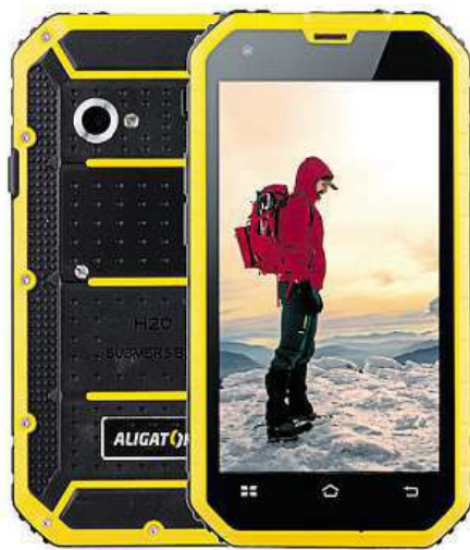
Aligator RX460 eXtremo

4,5" IPS displejem s qHD rozlišením 960 x 540 obrazových bodů. Snímky z výletů nebo třeba dokumentaci pracovních plánů zajišťuje dvojice fotoaparátů o rozlišení 8 a 5 Mpx, které samozřejmě nebyly ochuzeny ani o automatické ostření či „LEDkový“ blesk. Díky funkci Dual SIM je Aligator RX460 eXtremo schopen obsloužit hned dvě SIM karty najednou. Pokud se rozhodnete jednu z nich využívat jako datovou, určitě oceníte i podporu rychlého 3G internetu.