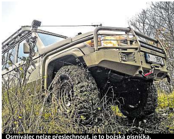
Osmiválec nelze přeslechnout, je to božská písnička.