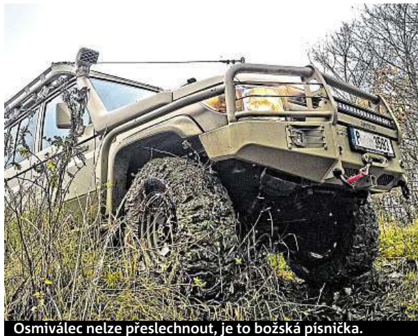
Osmiválec nelze přeslechnout, je to božská písnička.