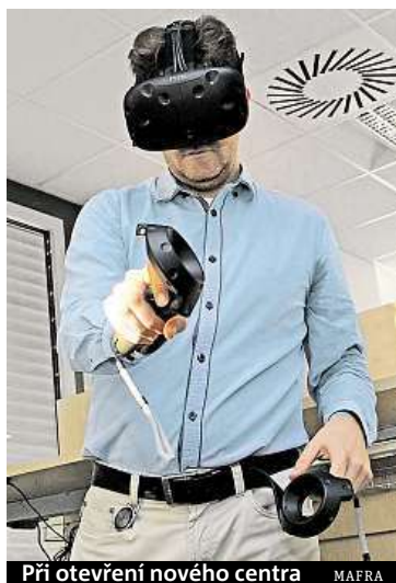
Při otevření nového centra MAFRA

trech jinou představu. Aktuálně Siemens v Česku zaměstnává více než 11 tisíc lidí a roste se. Má sedm výrobních závodů, výzkumná centra v Praze, Brně a nyní i Ostravě a dvě globální centra pro sdílené služby. Skupina elektrotechnických firem Siemens v Česku ve fiskálním roce končícím 30. září 2015 vytvořila zisk 1,36 miliardy korun (o pětinu nižší než v předchozím roce) a tržby 25,5 miliardy korun (o desetinu nižší). ČTK