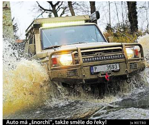
Auto má „šnorchl“, takže směle do řeky!