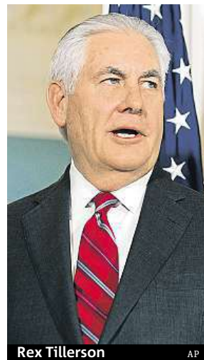
Rex Tillerson

Vysocí vládní úředníci údajně deníku sdělili, že Pompeo by měl v čele největší americké rozvědky nahradit senátor Tom Cotton, republikán ze státu Arkansas, který je klíčovým Trumpovým spojencem a odborníkem v otázkách národní bezpečnosti. S novým postem by souhlasil.