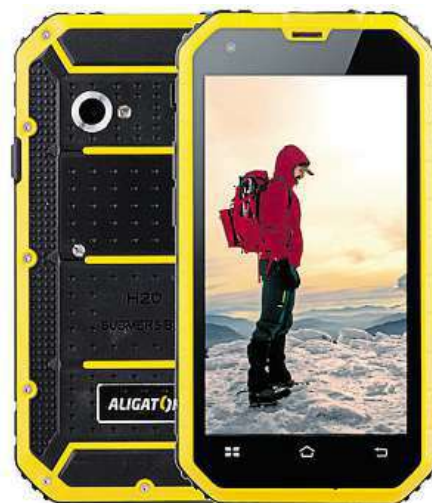
Aligator RX460 eXtremo

4,5" IPS displejem s qHD rozlišením 960 x 540 obrazových bodů. Snímky z výletů nebo třeba dokumentaci pracovních plánů zajišťuje dvojice fotoaparátů o rozlišení 8 a 5 Mpx, které samozřejmě nebyly ochuzeny ani o automatické ostření či „LEDkový“ blesk. Díky funkci Dual SIM je Aligator RX460 eXtremo schopen obsloužit hned dvě SIM karty najednou. Pokud se rozhodnete jednu z nich využít jako datovou, určitě oceníte i podporu rychlého 3G internetu.