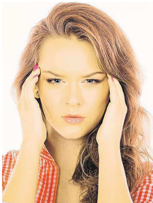
Stres je v dnešní době nedílnou součástí života.

Vedle kvalitní a zdravé potravy můžete svou nervovou soustavu vyživit pomocí doplňků stravy. Vhodným doplňkem je například FeliciteX. Jedná se o český doplněk stravy, který obsahuje hořčík, vitaminy skupiny B, biotin, vitamin C a kyselinu listovou. Tyto látky přispívají ke snížení míry únavy a vyčerpání a k normální psychické činnosti. V doplňku stravy dále najdete lecitin, který se nachází ve všech tělesných buňkách a bývá označován jako „potrava pro mozek“.