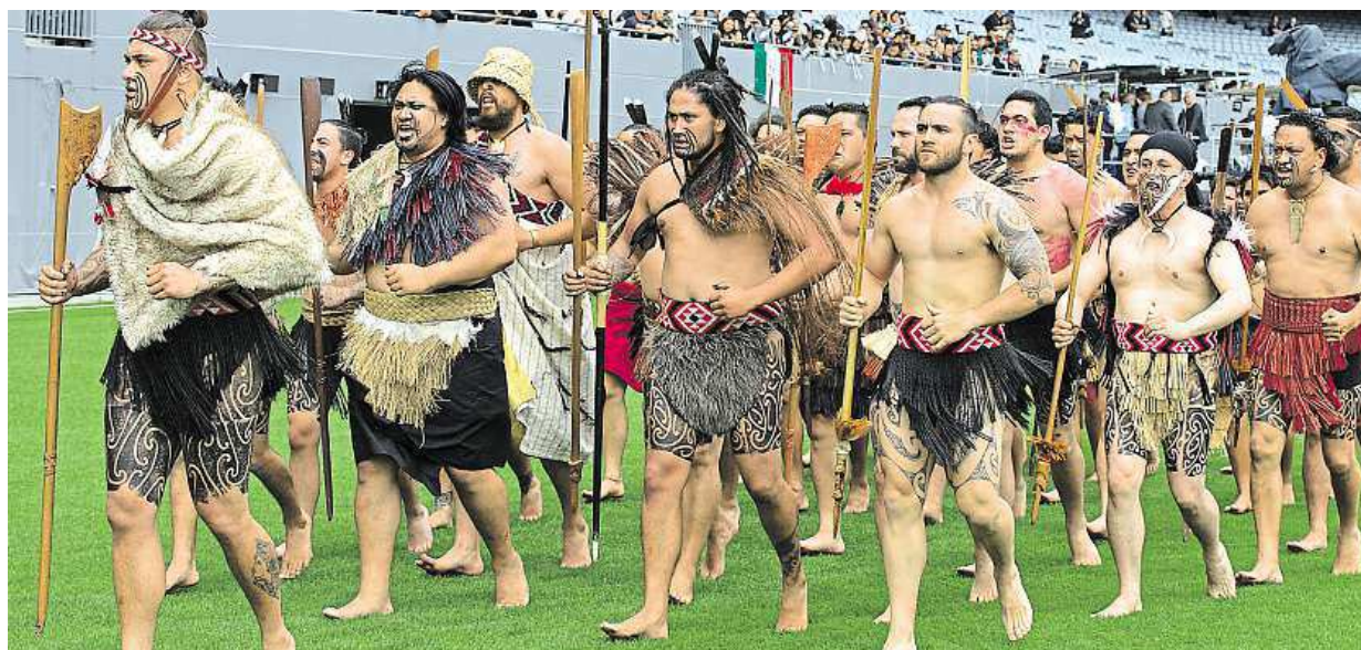
Tisíce lidí i z maorské komunity se včera přišly rozloučit s ragbyovou hvězdou Jonahem Lomu. Náhle zemřel ve věku 40 let.

Nebojíme se zadlužit. České domácnosti si půjčují stále víc peněz. Důvod. Nemají strach o svou existenci. Vánoční půjčka. Každý osmý Čech. Novinka posledních let. Pod stromek častěji také nové bydlení STRANA 2