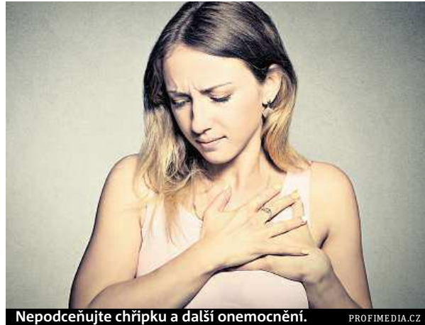
Nepodceňujte chřipku a další onemocnění.

Základním opatřením je nasazení antibiotik, především pokud je původcem bakterie. Ale podle Hanáka se antibiotika používají i v případě virových zápalů plic, i když