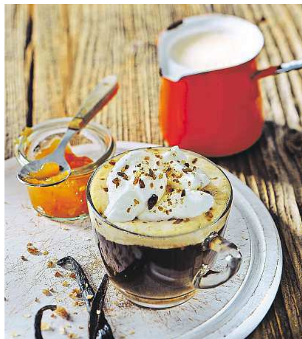
Rumové kouzlo vypadá lákavě, udělejte si ho také.