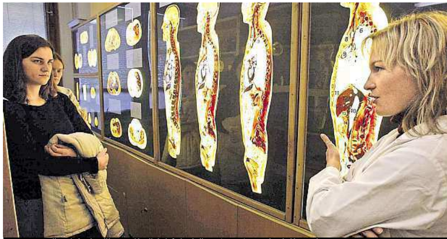
Den otevřených dveří na Lékařské fakultě Univerzity Palackého Olomouc

Některé vysoké školy sázejí i na doprovodné programy, které představují zábavnou formou náplň studia. Třeba Jihočeská univerzita. „Naše fakulty nejsou výjimkou. Zá-