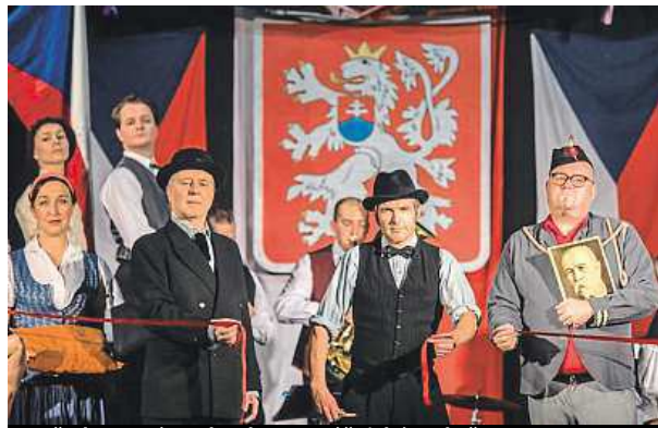
Z představení Dechovka v Baráčnických rychtě

Druhý večer patřil Maxim Gorki Theater z Berlína, která v koprodukcii s Junges Theater Basel představila hru autorky Sibylle Berg – Co je venku, do toho mi nic není . Čtyři naprosto identické „týpkyně“ v mikínách nám sdělují, jak to v životě mají. Že je prostě „cool“ se nevázat, nesnášet svoje rodiče, manipulovat, neustále chatovat, esemeskovat, ale mluvit politicky korektně a přitom neřít vůbec nic. Časem nám dojde, že jde jen o jednoho člověka,