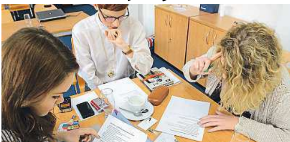
Získali skvělou zkušenost.

Kromě toho se studenti zúčastnili semináře Veřejno-právní rádio pro mladé, který se zaměřil na rozhlasové stanice v zahraničí i v České republice. Seminář se zabýval mimo jiné tím, jak získat mladé posluchače, rozvíjet program a vysílání rádia, jaké typy pořadů vytvářet a jak rozhlas propojovat s obsahem webu, videem či sociálními sítěmi. Více informací o projektu je na www.rozhlas.cz/presspektivy . MET