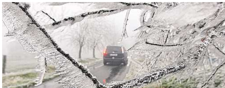
Na Třebíčsku už námraza nutí k opatrnosti.

Lyžaři mají z přicházející zimy radost, ale řidiči si již nyní musí dávat velký pozor. Zima se přihlásila jak na horách, tak také na silnicích. Na dnešní den si musí dát kvůli ledovce pozor hlavně řidiči na Vysočině a jižní Moravě.