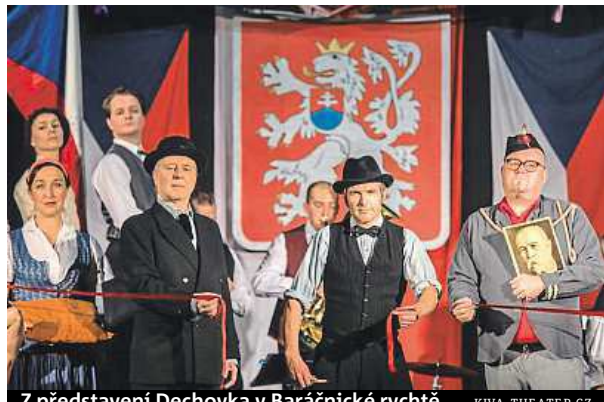
Z představení Dechovka v Baráčnické rychtě