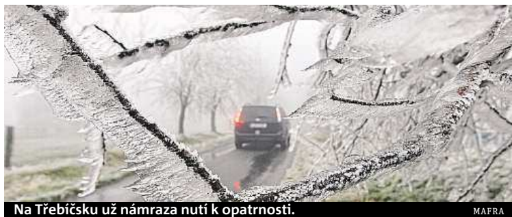
Na Třebíčsku už námraza nutí k opatrnosti.

Lyžaři mají z přicházející zimy radost, ale řidiči si již nyní musí dávat velký pozor. Zima se přihlásila jak na horách, tak také na silnicích. Na dnešní den si musí dát kvůli ledovce pozor hlavně řidiči na Vysočině a jižní Moravě.