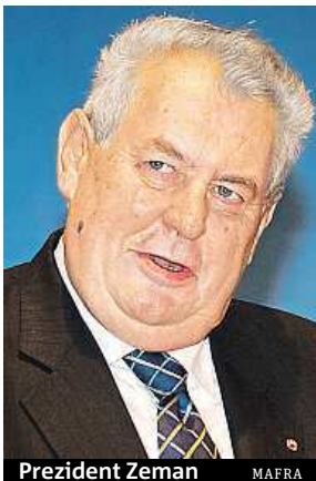
Prezident Zeman

„Je jasné, že existuje hodně lidí, kteří mají dost Miloše Zemana a nebojí se svůj názor projevit. Pro dosažení cíle je třeba vytrvat,“ burcuje obča-