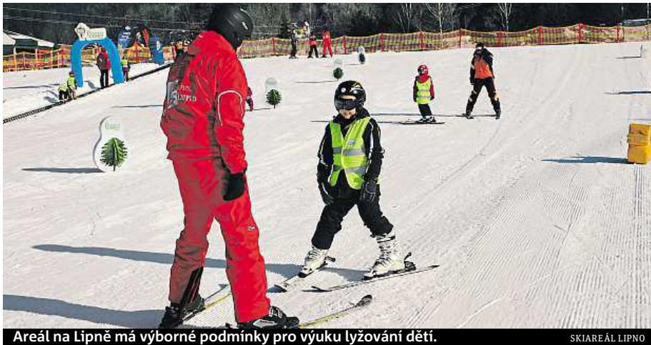
Areál na Lipně má výborné podmínky pro výuku lyžování dětí.

Na letošní zimní sezonu připravili ve Skiareálu Lipno novou Jezerní sjezdovku.