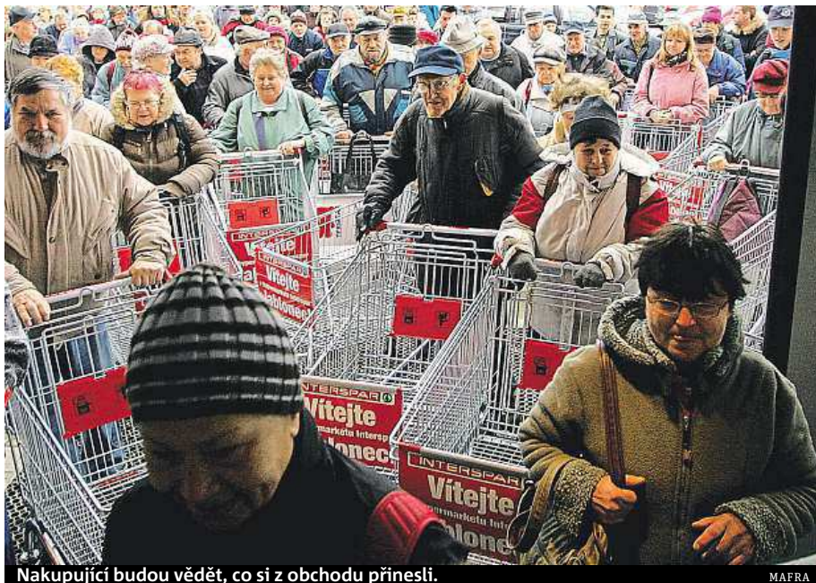
Nakupující budou vědět, co si z obchodu přinesli.

„Prodejcem potravin ale přináší zvýšené náklady na