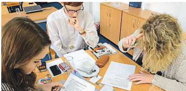
Získali skvělou zkušenost.

Kromě toho se studenti zúčastnili semináře Veřejno-právní rádio pro mladé, který se zaměřil na rozhlasové stanice v zahraničí i v České republice. Seminář se zabýval mimo jiné tím, jak získat mladé posluchače, rozvíjet program a vysílání rádia, jaké typy pořadů vytvářet a jak rozhlas propojovat s obsahem webu, videem či sociálními sítěmi. Více informací o projektu je na www.rozhlas.cz/presspektivy . MET