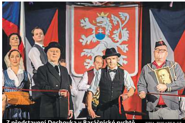
Z představení Dechovka v Baráčnické rychtě KIVA, THEATER.CZ

Divadelní festival německého jazyka dnes vyvrcholí.