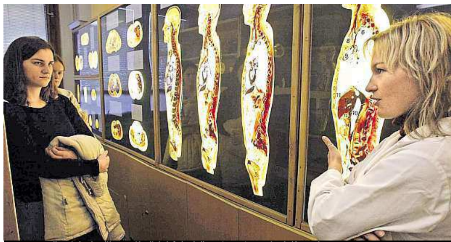
Den otevřených dveří na Lékařské fakultě Univerzity Palackého Olomouc

Některé vysoké školy sázejí i na doprovodné programy, které představují zábavnou formou náplň studia. Třeba Jihočeská univerzita. „Naše fakulty nejsou výjimkou. Zá-