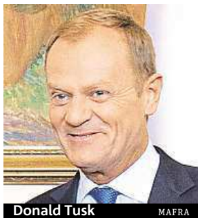
Donald Tusk MAFRA

Tuska vybrali prezidentí a premiéři zemí osmadvacitky jako předsedu svých jednání na konci srpna. Polský politik, u kterého bývá zdůrazňováno jeho evropanství a schopnosti prokázané v do-