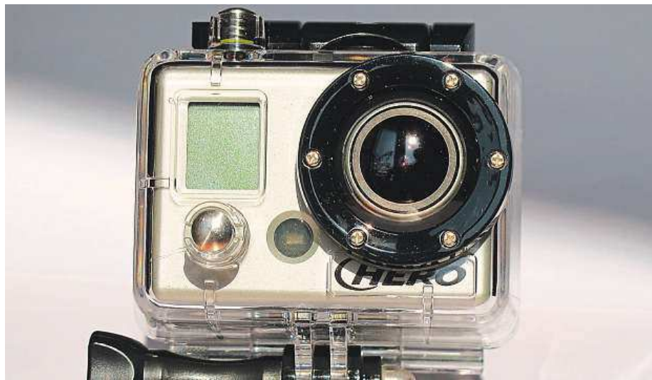
Kamery v autě používá čím dál tím více řidičů.

Na kvalitu kamer si posvítil velký test Ústředního automotoklubu (ÚAMK). Hodnotil kamery, které jsou nyní v prodeji (viz box). „Test jasně potvrdil fakt, že levné kamery okolo tisíce korun jsou na špatné úrovni a kvalitnější seženete od hranice dvou tisíc korun. Zařadili jsme do něj i