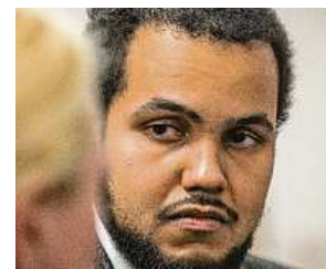
Expolitik u soudu