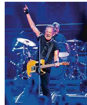
The Boss přijede do ČR. ARCHIV

S hudbou začal Springsteen ve třinácti letech poté, co na vlastní oči viděl vystoupení Elvise Presleyho. O deset let později podepsal smlouvu se společností CBS Records, která v něm viděla „nového Dylana“. Vydal 21 studiových alb. Jeho zatím poslední deska s názvem Only the Strong Survive vyšla loni. ČTK