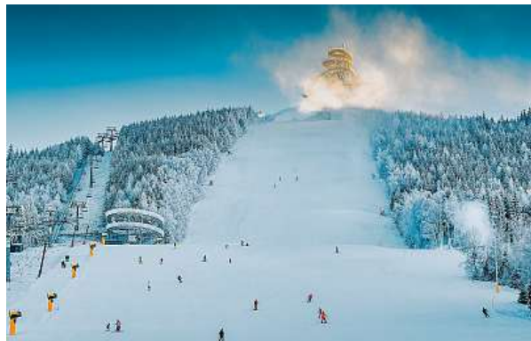
Samotné lyžování už nestačí. Pro návštěvníky je důležité zázemí i další možnosti vyžití v nejbližším okolí.

Chceme na horách i Slováky Udržitelnost se ale projevuje i v tom, že je v areálech stále víc nádob na tříděný odpad. „Jsou z recyklovaných materiálů, my tento trend podpo-