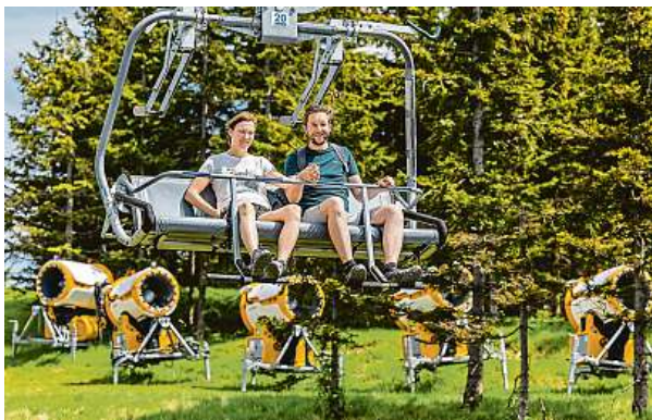
Letní idylka skončila, i když ještě nemrzne. Zasněžovací technika je už ve většině areálů zkontrolována a čeká na první spuštění.

Modernizace zimních radovánek vyšla letos provozovatelům areálů (asociace sdružuje asi dvě třetiny všech areálů v Čes-