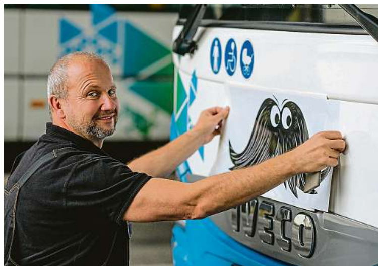
Dopravní podnik Karlovy Vary podporuje Movember i v letošním roce. Po celý listopad potkáte také v pražských ulicích dvacet autobusů a tramvají vyzdobených knírem.