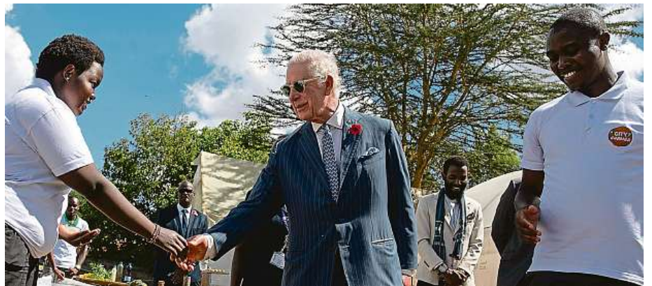
Král na návštěvě projektu městského zemědělství v nemocnici Mama Lucy Kibaki v Nairobi

Karel III. by se během své návštěvy měl vyjádřit i ke krutostem z dob britské koloniální éry včetně hromadného mučení a zabíjení obyvatel a rozsáhlého vyvlastňování jejich půdy, na níž v současnosti hospodaří britští občané