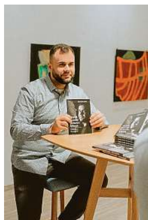
Poté se rozhodl, že napíše knihu.