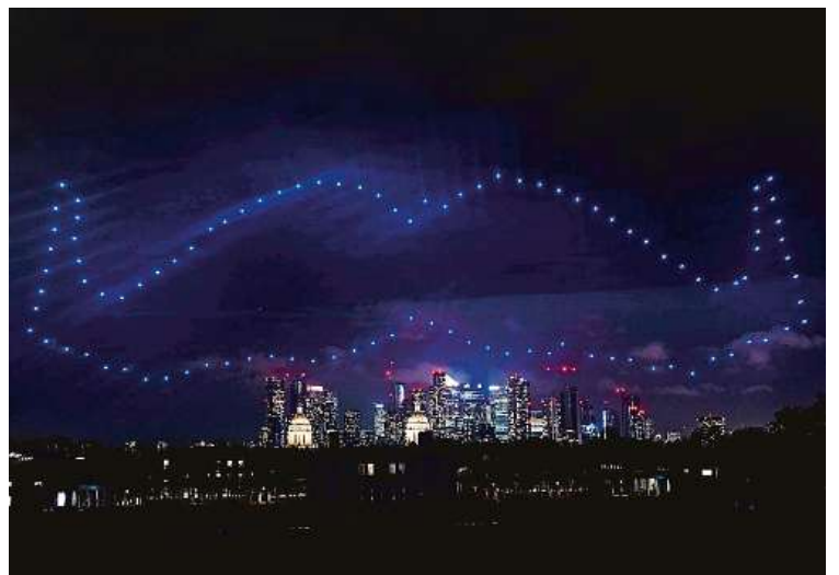
Stovka dronů vytvořila na obloze nad Londýnem, Edinburhem, Gatesheadem a Liverpoolem obří stovcetimetrový knír.