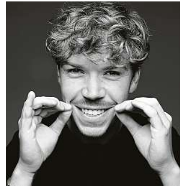
Do akce se zapojují celebrity z celého světa. I herec Will Poulter. 2x MOVEMBER UK

Je tu Movember! Měsíc prevence mužských onemocnění. Vousy narostou policistům, celebritám i tramvajím a autobusům po celém Česku.