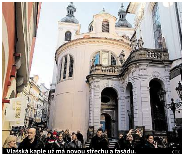
Vlašská kapele už má novou střechu a fasádu.

Během oprav se podařil i zajímavý náleze, nad lucernou a ve zvonici kapele čekaly na náleze dva kovové tubusy