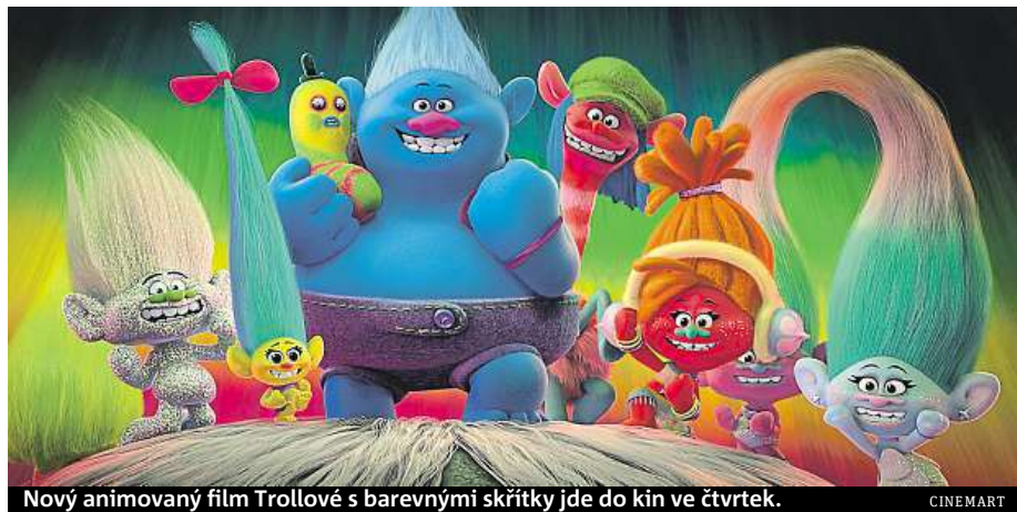
Nový animovaný film Trollové s barevnými skřítky jde do kin ve čtvrtek. CINEMART

Ústřední píseň k novému filmu Can't Stop the Feeling od Justina Timberlaka se stala hitem léta.