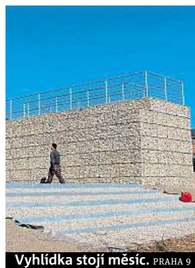
Vyhlídka stojí měsíc. PRAHA 9

Vyhlídka se stala vděčným terčem také pro místní spolky. Ty kritizují nejen samotný projekt, u kterého měly stavební práce finišovat již v dubnu, ale i vysokou pořizovací cenu. „Vyhlídku s velkým V zbudovala radnice za asi dvacet milionů korun. Pů-