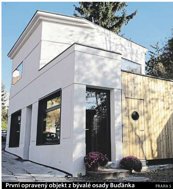
První opravený objekt z bývalé osady Budánka

Na místech objektů, které už nejde zachránit, dostanou šanci architekti. „Nechceme stavět repliky, chceme dát prostor soudobé architektuře,“ dodává Richter. S tím souhlasí i památkáři, stavby na Budánkách vznikly jako nouzové domy pro dělníky, nemají žádnou uměleckou hodnotu, tu má jen atmosféra celého místa. Vzniknout zde mohou jak ateliéry pro uměl-