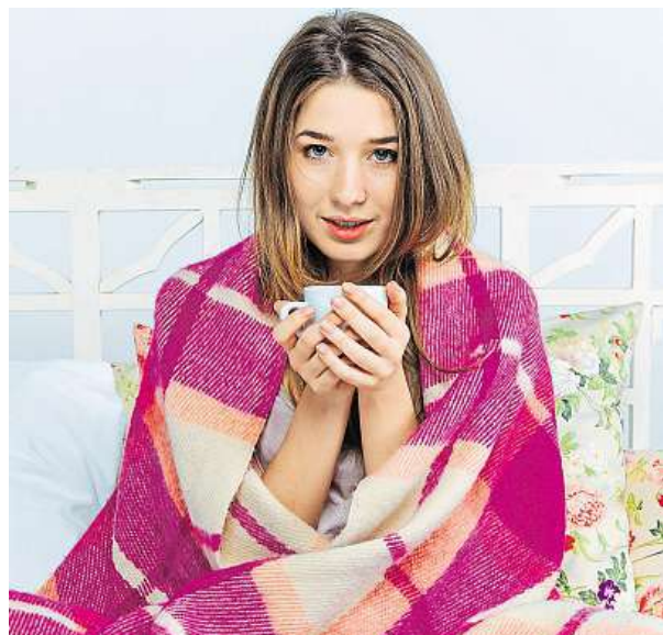
Chřipkou jsou určité skupiny víc ohrožené.

mích k nejčastějším příčinám úmrtí. Každoročně u nás zemře přibližně 60 000 osob trpících nemocemi srdce a cév. Léčba chřipky je u těchto pacientů mnohem obtížnější, protože více tekutiny v plicích ztěžuje odstraňování chřipkového viru. Ve srovnání se zdravým člověkem je kardiak chřipkou ohrožen na životě více než 52krát. Navíc mu hrozí dvojnásobně větší riziko infarktu ještě několik týdnů po vyléčení chřipky. KAMILA HUDEČKOVÁ