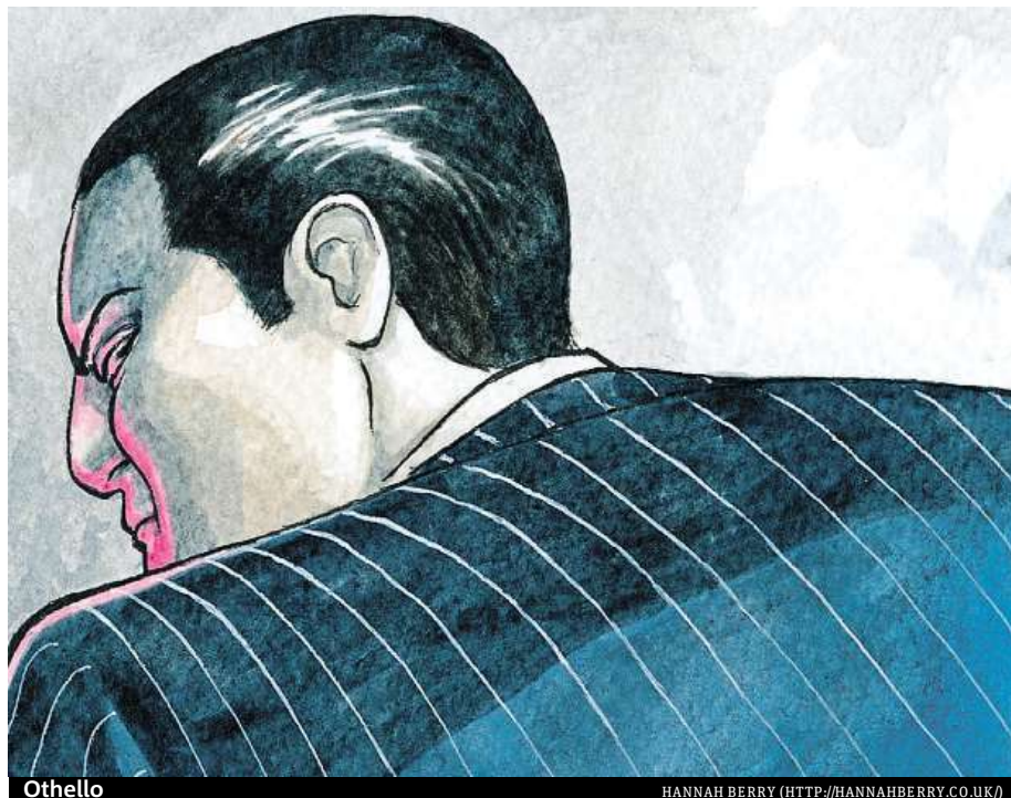
Othello

This series is marking the 400th anniversary of Shakespeare's death.