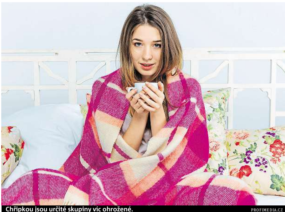
Chřipkou jsou určité skupiny víc ohrožené.

Riziková skupina není malá, čítá až 2,5 milionů lidí. Kromě starších 65 let jsou to lidé s chronickým onemocněním srdce a cév, dýchacích cest, ledvin, jater nebo diabetici. Dále sem patří pacienti po odstranění sleziny