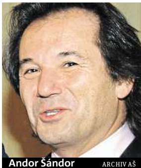
Andor Šándor

Složky jednotného záchranného systému jsou dobré, fungují ale v nedostatečných počtech. Armáda je podfinancovaná, podzbrojená a pod stavem, například hasičů je také málo. Do této chvíle se totiž řešila pouze civilní obrana. Rada lidí tak vůbec