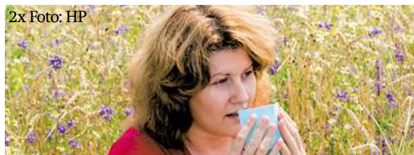
2x Foto: HP

struktura je velmi podobná léku pentamidin, který se proti parazitům používá od války. V součinnosti s piperinem, selenem a jódem tak vytváří adekvátní imonodpověď našeho organismu.