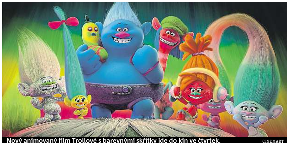
Nový animovaný film Trollové s barevnými skřítky jde do kin ve čtvrtek.

Žádného už však na jídelníčku dlouho neměli. Trollůmu králi Peppymu se totiž podaří i se všemi jeho poddanými utéct a založit vlastní veselé městečko Trollíkov, které se Bergenům nedaří nalézt.