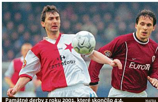
Památné derby z roku 2001, které skončilo 4:4.

Na největší stadion v zemi dorazilo na derby v roce 1965 rekordních padesát tisíc diváků. Do hlediště dojel i slávistický příznivec Pacák, kterého ze Smržovky přivezl na trakaři za devět dní spartan Pavlíček. Ten totiž prohrál sázku, neboť tvrdil, že červenobílí nepostoupí do první ligy. Sešivaný nováček favorita zaskočil a Sparta nakonec zachránila aspoň remízu 2:2.