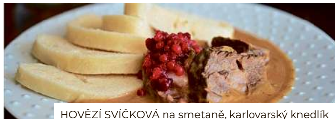
HOVĚZÍ SVÍČKOVÁ na smetaně, karlovarský knedlík

EFI SPA HOTEL**** nám. 28 října 23, Brno, +420 515 557 500, recepce@efispahotel.cz , www.efispahotel.cz