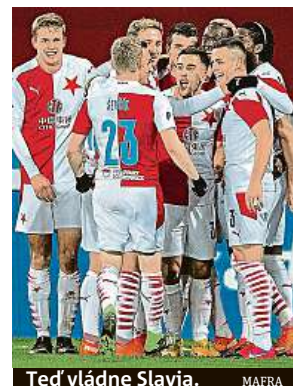
Teď vládne Slavia.