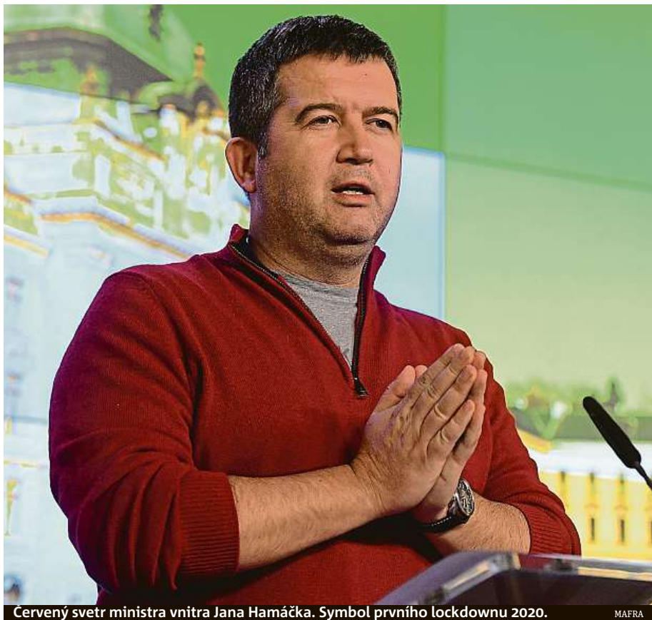
Cervený svetr ministra vnitra Jana Hamáčka. Symbol prvního lockdownu 2020.