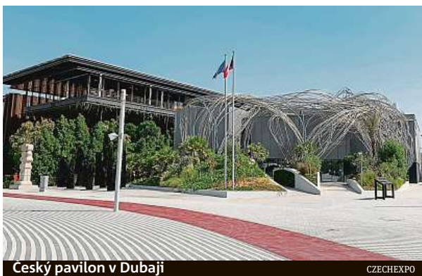
Český pavilon v Dubaji

Design pavilonu udržitelnosti vytvořilo britské architektonické studio Grimshaw, koncepci pavilonu mobility navrhlo britské studio Foster + Partners a pod podobou pavilonu příležitosti je podepsána španělsko-kuvajtská firma Agi Architects. Autorem projektu pavilonu pořadatelské