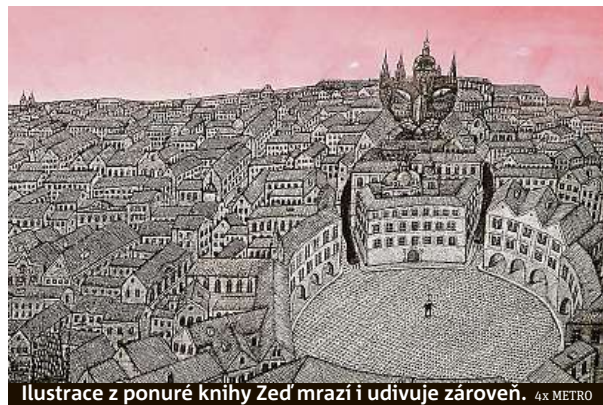
Ilustrace z ponuré knihy Zeď mrazí i udivuje zároveň. 4x METRO