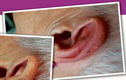
Odstranění stařecké keratózy