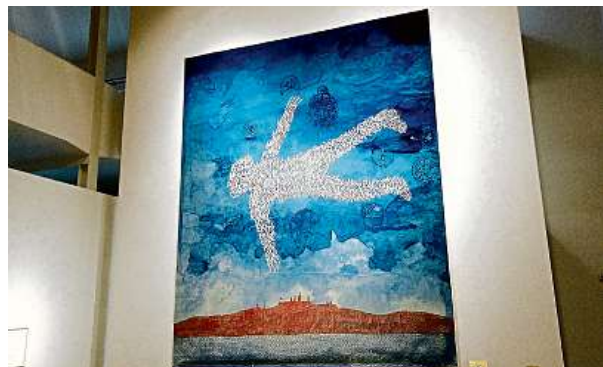
Tapiserie Poslední audience na počest Václava Havla