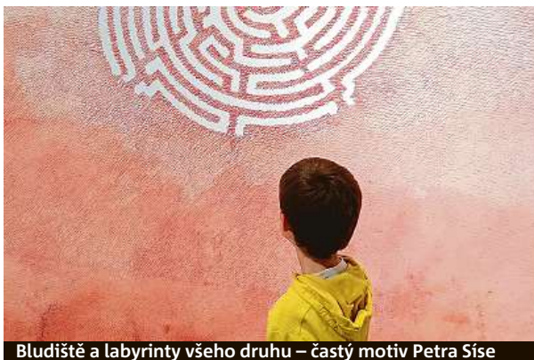
Bludiště a labyrinty všeho druhu – častý motiv Petra Síše