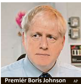
Premiér Boris Johnson

Před dvaceti lety ji dělala šéfa, teď mu připomněla, že na ni sáhl.