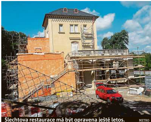
Šlechtova restaurace má být opravena ještě letos. METRO

Právě herbicid či podobná chemikálie stály i za kauzou, kterou místní zaregistrovali před pár měsíci. U jezírek ve středu parku se totiž začaly v červenci objevovat podomácku vyrobené cedulky. Ty varovaly před travičem labutí, který měl podle nich způ-