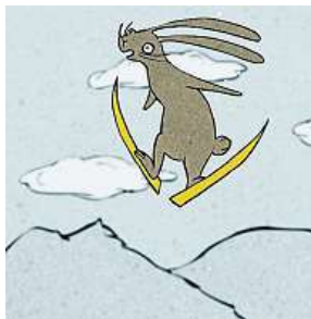
Ke startu připravit! ARCHIV

Zájemci o studium se budou moci o škole více dozvědět na stáncích v kavárně kina. Během odpoledne zde reprezentanti škol zodpoví dotazy zájemců a nabídnou propagační materiály.