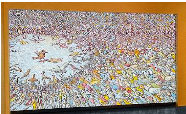
Slavná ilustrace z knihy Ptačí sněm nesmí chybět.

Termíny je důležité sledovat. Například ve dnech 20. a 21. října tam proběhnou hned tři rodinná představení Divadla Drak – „Zeď aneb jak jsem vyrůstal za železnou oponou“. Půjde o pražskou premiéru hry na motivy stejnojmenné knihy Zeď právě od Petra Síše. HOPE