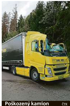
Poškozený kamion

Podle informací Českého hydrometeorologického ústavu do šesté hodiny ranní znamenala nejvyšší náraz větru na území Česka Sněžka, kde foukalo rychlostí 157 kilometrů za hodinu. V Kocelovicích nebo Příbrami byla rychlost větru 81 km/h, v Klatovech 75 km/h a v Praze 68 km/h. Během dne vítr na některých místech republiky i zesílil. Meteorologové už v neděli upozornili, že padat mohou i stromy oslabené suchem nebo kůrovcem. Navíc