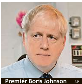
Premiér Boris Johnson

Před dvaceti lety jí dělал šéfa, teď mu připomněla, že na ni sáhl.