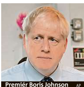
Premiér Boris Johnson

Před dvaceti lety jí dělал šéfa, teď mu připomněla, že na ni sáhl.