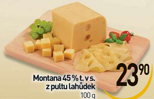
Montana 45% t. v. s. z puttu lahůdek 100 g