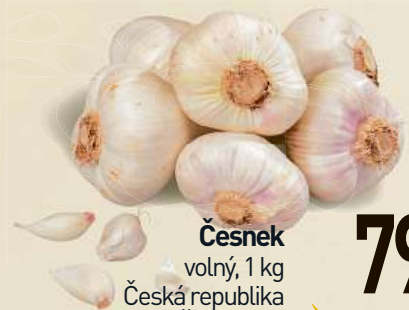
Česnek volný, 1 kg Česká republika / Španělsko