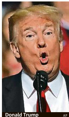
Donald Trump

Americký prezident promluvil o svém vztahu se severokorejským vůdcem.