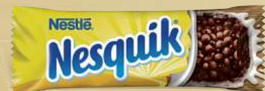
Nestlé Cereální tyčinky od 23 g, více druhů