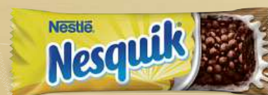
Nestlé Cereální tyčinky od 23 g, více druhů