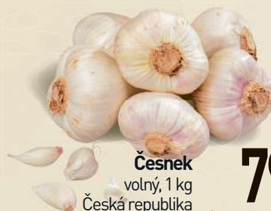
Česnek volný, 1 kg Česká republika /Španělsko