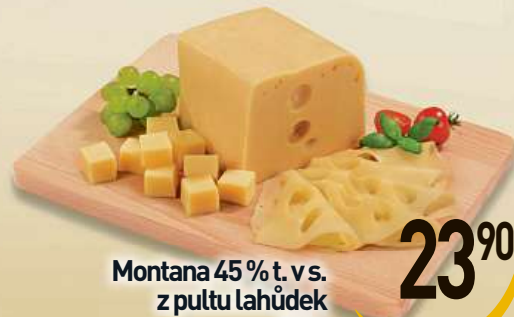
Montana 45 % t. v. s. z putu lahůdek 100 g