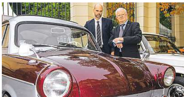
Před 25 lety po Němcích v Praze zůstaly stovky trabantů.

Genscherovo krátké vystoupení a následný odjezd tisíců utečenců, kteří od léta doslova okupovali ambasádu, se poté staly jedním ze symbolů konce komunistického režimu v NDR.