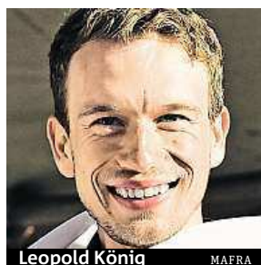
Leopold König

Český cyklista Leopold König bude od nové sezony jezdit v barvách britské stáje Sky. Sedmý muž letošního Tour de France podle očekávání opouští tým z druhé divize NetApp-Endura, přednímu týmu World Tour se upsal na dva roky. Šestadvacetiletý Kö-