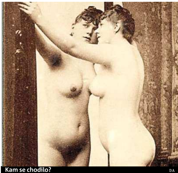
Kam se chodilo?

Festival Den architektury se však neomezuje pouze na Prahu, cyklovýlety, workshopy a komentované prohlídky čekají na zájemce v celkem 52 měs-