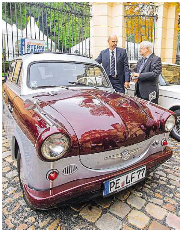
Před 25 lety po Němcích v Praze zůstaly stovky trabantů.