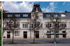
EFI SPA Hotel**** Superior & Pivovar

Dluhopisy e-Finance můžete objednávat přes internet, emailem, telefonicky, osobně.