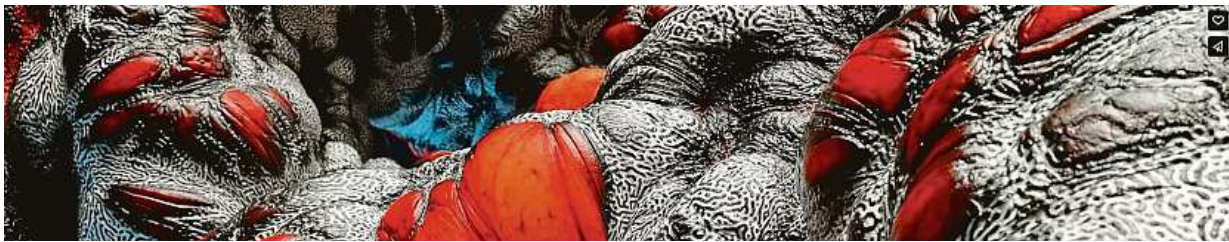
Obsedant se v minulosti v rámci projektu Pupa ponořil do nekonečné škály abstraktních kompozic, forem a atmosfér.

Obsedantova spolupráce s Converse není jeho prvním spojením se značkou bot. V minulosti tvořil animace i pro Gore-tex. JAR