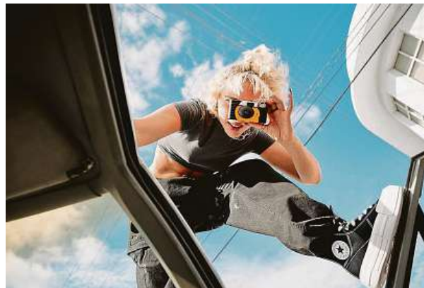
Chuck Taylor All Star a One Star tenisky se nosí už po více než jedno století. Na festivalu se představí jako digitální instalace. CONVERSE