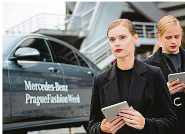
Mercedes-Benz Prague Fashion Week bude tradičně spojen s představením nejnovějších modelů značky Mercedes-Benz. MBPFW