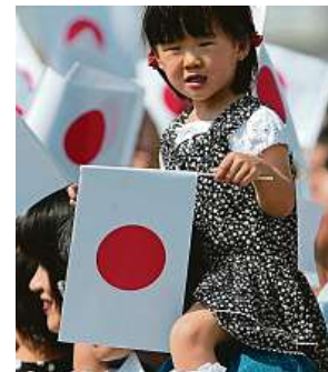
Japonská populace stárne, děti se rodí málo.