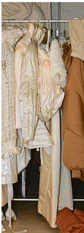
I tyto studentské kousky uvidíte na MBPFW. ADĚLA ZLÁMALOVÁ