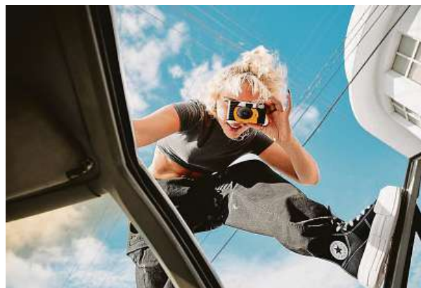
Chuck Taylor All Star a One Star tenisky se nosí už po více než jedno století. Na festivalu se představí jako digitální instalace. CONVERSE