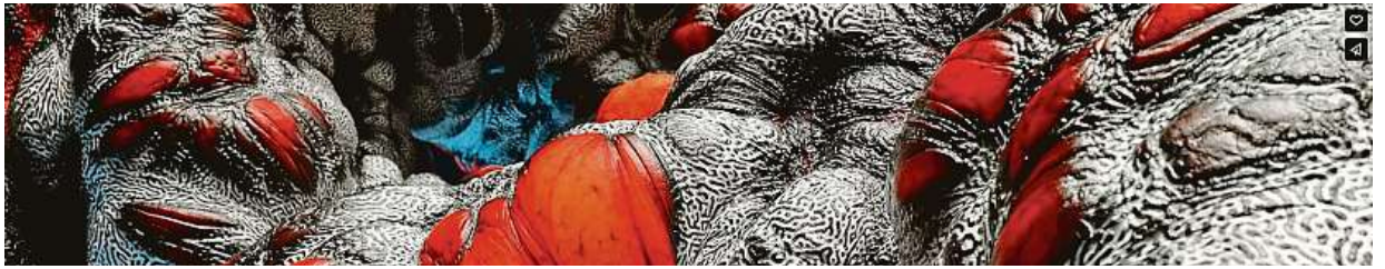
Obsedant se v minulosti v rámci projektu Pupa ponořil do nekonečné škály abstraktních kompozic, forem a atmosfér.

Obsedantova spolupráce s Converse není jeho prvním spojením se značkou bot. V minulosti tvořil animace i pro Gore-tex. JAR