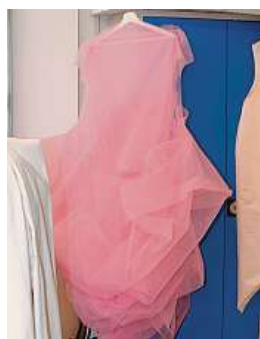
Přípravy na výstavní akci Moje značka ADÉLA ZLÁMALOVÁ