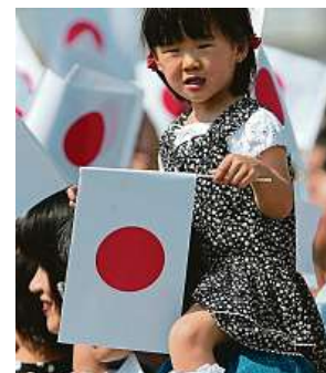
Japonská populace stárne, děti se rodí málo.