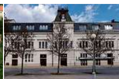
EFI SPA Hotel**** Superior & Pivovar

vence 2023 nabídne Předzámčí nově i moderní sál – Konírnu. Tento sál je vhodný pro pořádání svateb, firemních akcí, konferencí apod.