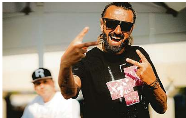
Po určitém čase se děti dostanou i do soutěžních složek, a tak mají šanci podívat se i do zahraničí.

Podle něj ani není podstatné, v jakém věku začnou děti tančit. Důležité je, že je to chytne a položí se do toho. „Každopádně jsou v tanci i další benefity, jako například psychické a fyzické zdraví, kdy tanečník formuje svoje tělo i rozvíjí myšlení, pracuje s emocemi, zapadá do kolekti-