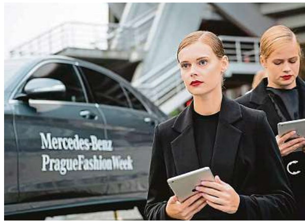
Mercedes-Benz Prague Fashion Week bude tradičně spojen s představením nejnovějších modelů značky Mercedes-Benz. MBPFW