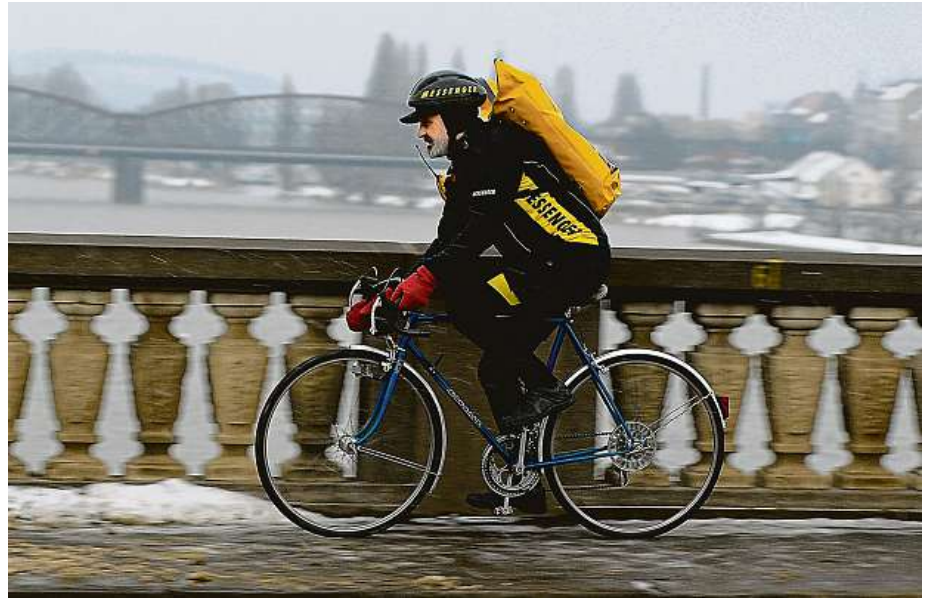
Vzpouza proti zaběhnutým představám o důchodcích ve filmu Vratné lahve. Zdeněk Svěrák odmítl se svými vrstevníky sypat ptáčkům v parku a zkusil to na penzi jako poslíček na kole.

Statistiku je ale nutné číst i tak, která ze skupin řidičů na českých silnicích je početně nejsilnější a která současně jezdí nejvíce. U starších řidičů lze předpokládat, že za volant usedají méně často. Nic to ale nemění na faktu, že nehod zaviní mnohem méně než ti mladší. Majitel liberecké