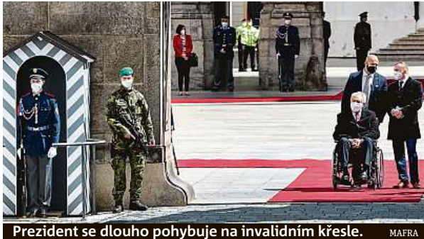
Prezident se dlouho pohybuje na invalidním křesle.

V Brně zahájí školní rok v základní a mateřské škole v Merhautově ulici. V minulosti pro přelety v Česku politici používali především armádní vrtulníky. K dispozici měli také menší letouny Jak-40, které ale už byly z armádní výzbroje vyřazeny, životnost končí i dalšímu menšímu letadlu Challenger.