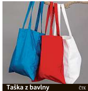
Taška z bavlny

Reportéři listu vypočetli, že biobavlněnou tašku by bylo potřeba použít 20tisíckrát, aby vynahradila celkový dopad na svou výrobu. Jinými slovy, tašku by bylo nezbytné používat 54 let. Noviny se při