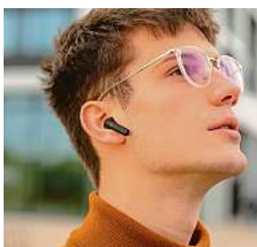
Niceboy HIVE Pins 2x MIRONET

Ovládání hudby nebo přijímání hovorů je pohodlné, jelikož ho ovládáte prostými dotyky přímo na sluchátkách. Ta vydrží klidně i pobyt