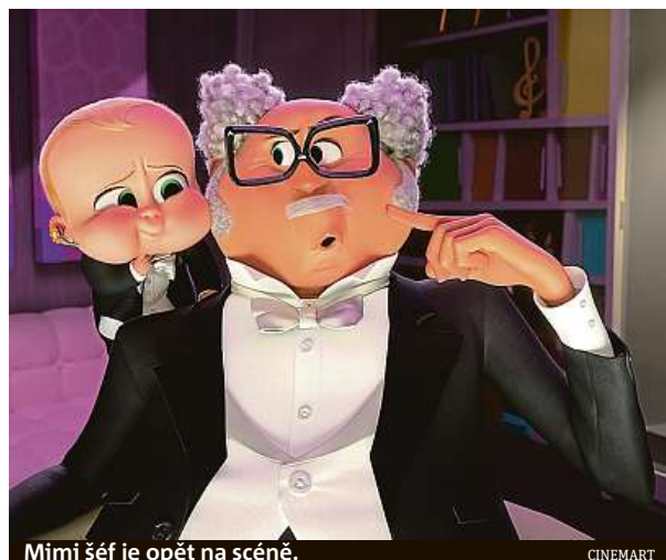
Mimi šéf je opět na scéně.

Tabitha, která chodí do školy pro nadané děti, má za největší vzor strejdu Teda, což jejího otce trochu rozčiluje, protože s bráchou fakt vůbec nevychází. To ovšem ještě netuší, jaké nečekané společné stmelovací dobrodružství je čeká.