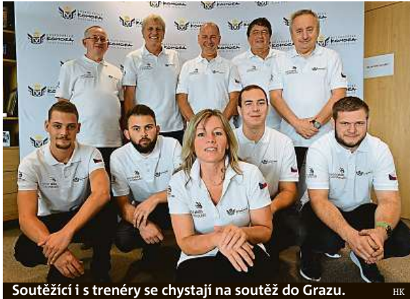
Soutěžící i s trenéry se chystají na soutěž do Grazu.