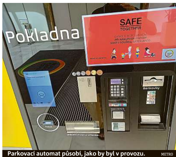
Parkovací automat působí, jako by byl v provozu. METRO

Domněnky místních o zavedení parkovně v následujících