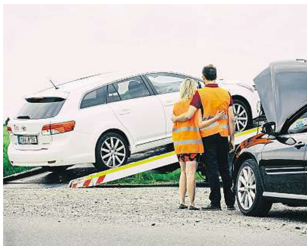
Klienti po nehodě spolupracují s odtahovkou.