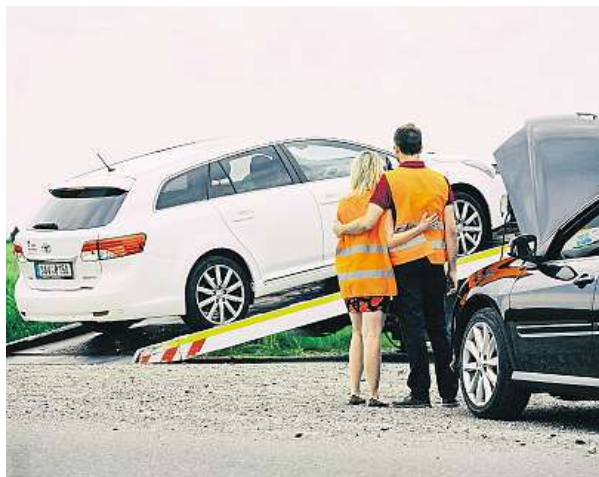
Klienti po nehodě spolupracují s odtahovkou.