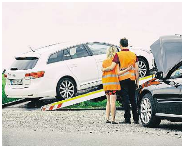
Klienti po nehodě spolupracují s odtahovkou.