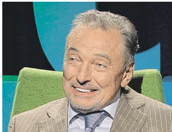
Karel Gott v pořadu Všechnopárty

V prvním dílu podzimní sezony zpovídal moderátor kromě čtyřicetinasobného nositele Slavíka také herečku